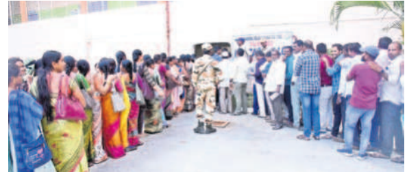
పోస్టల్ బ్యాలెట్ ఓటు వేసేందుకు క్యూలో నిల్చున్న అధికారులు