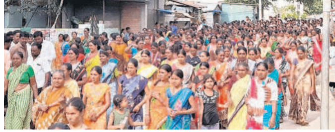
అయిజు : ఎన్నికల ప్రచారంలో పాల్గొన్న కార్యకర్తలు, ప్రజలు