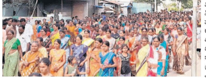
అయిజు : ఎన్నికల ప్రచారంలో పాల్గొన్న కార్యకర్తలు, ప్రజలు