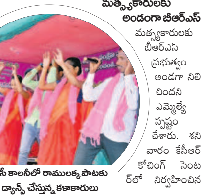
బీసీ కాలనీలో రామలక్ష్మిపాటకు డ్యాన్స్ చేస్తున్న కళాకారులు