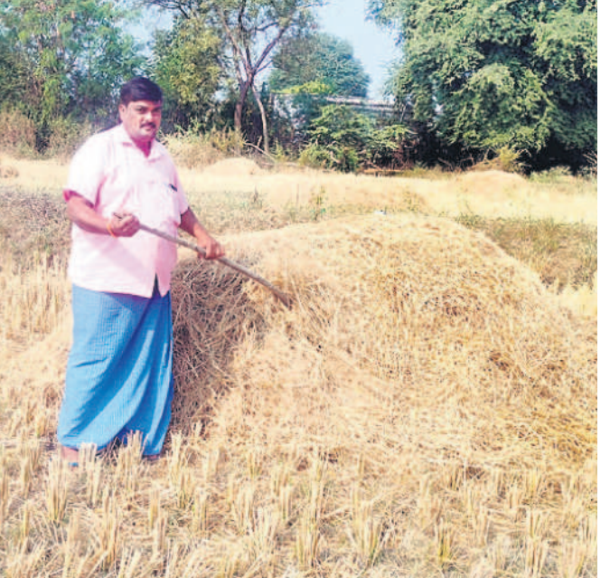
- పెక్కల రైతు, బాలాజీపల్లి (జాలపల్లి)

మాకు 15 ఎకరాల భూమి ఉన్నది. పరి, పత్తి, మక్క పంటలు సాగు చేసుకుంటున్నం. ముఖ్యమంత్రి కేసీఆర్ తీసు కొచ్చిన ధరణి పోర్టల్ కాంగ్రెస్లో వద్దంటున్నరు. వాళ్ళ పాలనకే భూముల రికార్డులు అస్సపస్తం చేసి రైతులను గోస పెడుతరు.