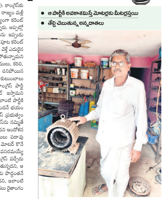
• ఆ పార్టీకి అవకాశమిస్తే మోటర్లకు మీటర్లన్నాయి • తేల్చి చెబుతున్న లన్నదాతలు

కరెంట్, నవంబర్ 25 (నమస్తే తెలంగాణ ప్రతినిధి): కాంగ్రెస్కు ఓటేస్తే బతుకు వెరువు కరువైతదని, పనేండ్ల కిందటి చీకటి రాజ్యం మళ్ళీ వస్తుందని జిల్లా రైతులు ఆందోళన చెందుతున్నారు. ముఖ్యంగా కరెంట్ విషయంలో రైతులు పడేన కష్టాలను గుర్తు చేసుకుంటున్నారు.