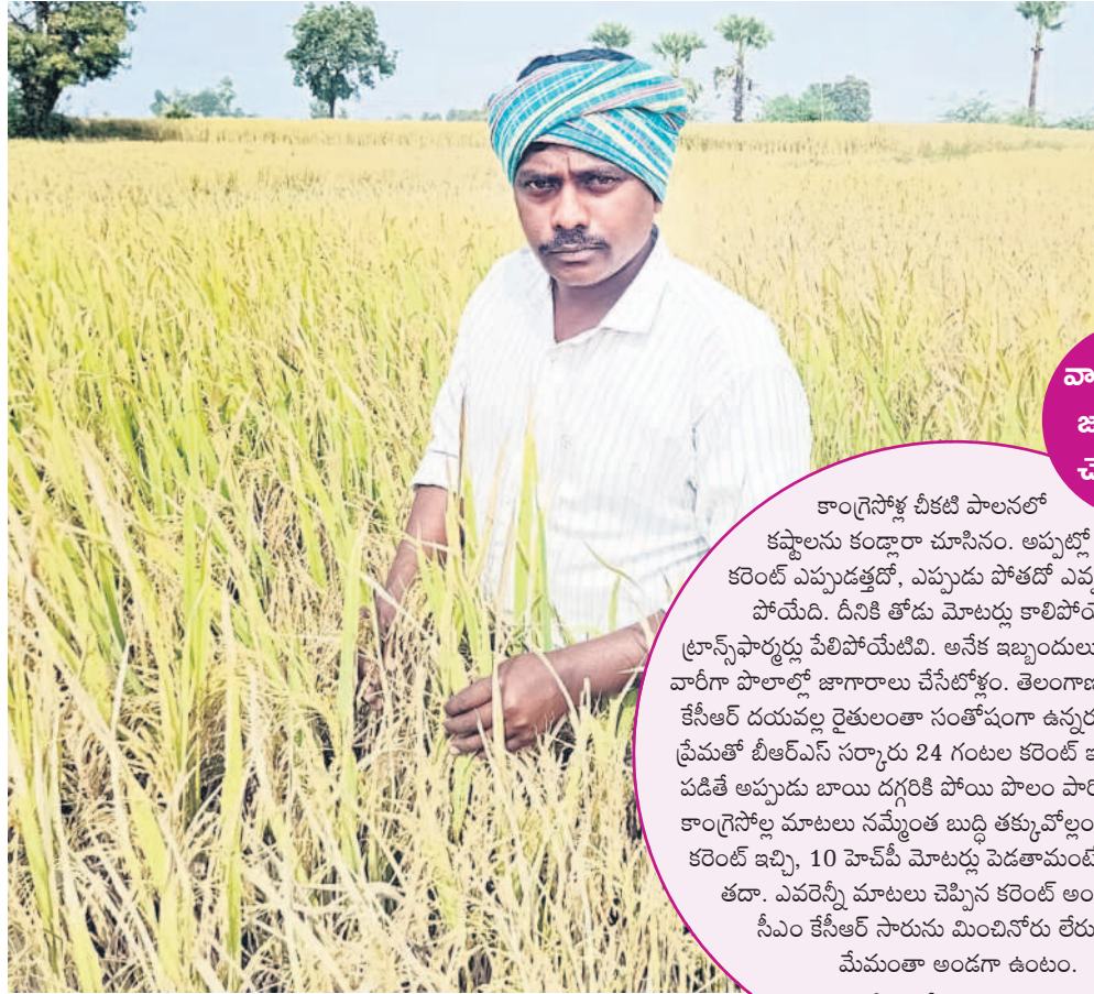
వాళ్లున్నప్పుడు జాగ్రాదాలు చేసేటోళ్ళం

కాంగ్రెస్లో చీకటి పాలనలో కష్టాలను కండ్లారా చూసినం. అప్పట్లో కరెంట్ ఎప్పుడక్కడో, ఎప్పుడు పోతదో ఎవ్వరికీ తెలుక పోయేది. దీనికి తోడు మోటర్లు కాలిపోయేటియి.