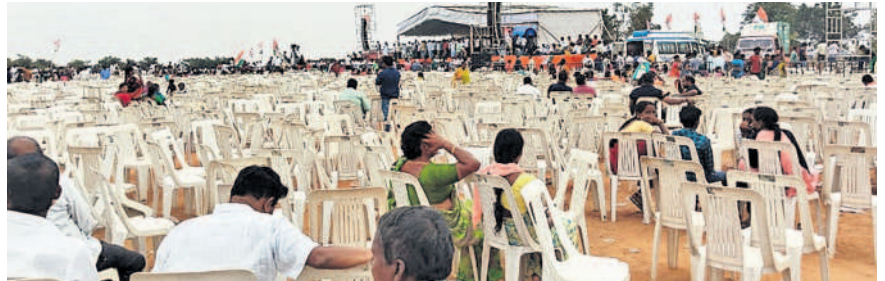
షాద్ నగర్ లో నిర్వహించిన కాంగ్రెస్ సభలో జనం లేక దర్శనమిస్తున్న ఖాళీ కుర్చీలు..

జిల్లాలో మూడు చోట్ల కాంగ్రెస్ సభలు అట్టర్ ఫ్లాప్ జనం లేక వెలవెలబోయిన సభా ప్రాంగణాలు షాద్ నగర్ లో సభకు ముఖం చాటిసిన రేవంత్ వేచి చూసి విసిగిపోయి ఇంటిముఖం పట్టిన జనం ఆమనగల్లులో జరిగిన మల్లికార్జున్ ఖర్చే, రేవంత్ సభకు ముందుగానే జనం జంప్ తుర్కయాంజాల్ కార్నర్ మీటింగ్ కూరేవంత్ డుమ్మా చర్చనీయాంశంగా ఎంపీ వెంకటరెడ్డి గైర్హాజరు