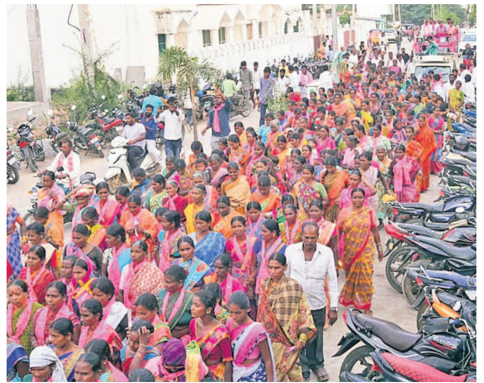
వెల్దుర్తిలో భారీ రాళ్ళి నిర్వహిస్తున్న మహిళలు, బీఆర్ఎస్ శ్రేణులు