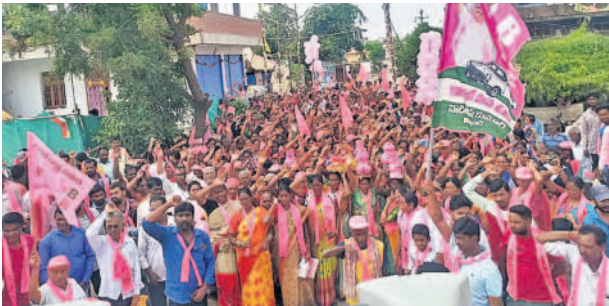
12, 13వ వార్డుల్లో బతుకమ్మలు, బోనాలతో ఊరేగింపుగా వస్తున్న మహిళలు

హుస్సాబాద్ టౌన్, నవంబర్ 25 : పట్టణంలో శనివారం బీఆర్ఎస్ నిర్వహించిన ఎన్నికల ప్రచారంలో ప్రజలు పెద్ద సంఖ్యలో పాల్గొని ఎమ్మెల్యే సతీశ్ కుమార్ కు మద్దతు పలికారు. 5, 12, 13 వార్డుల్లోని మహిళలు బతుకమ్మలు, బోనాలతో ఎమ్మెల్యేకు స్వాగతం పలికారు. సతీశ్ కుమార్ ను గెలిపిస్తామంటూ నినదించారు.