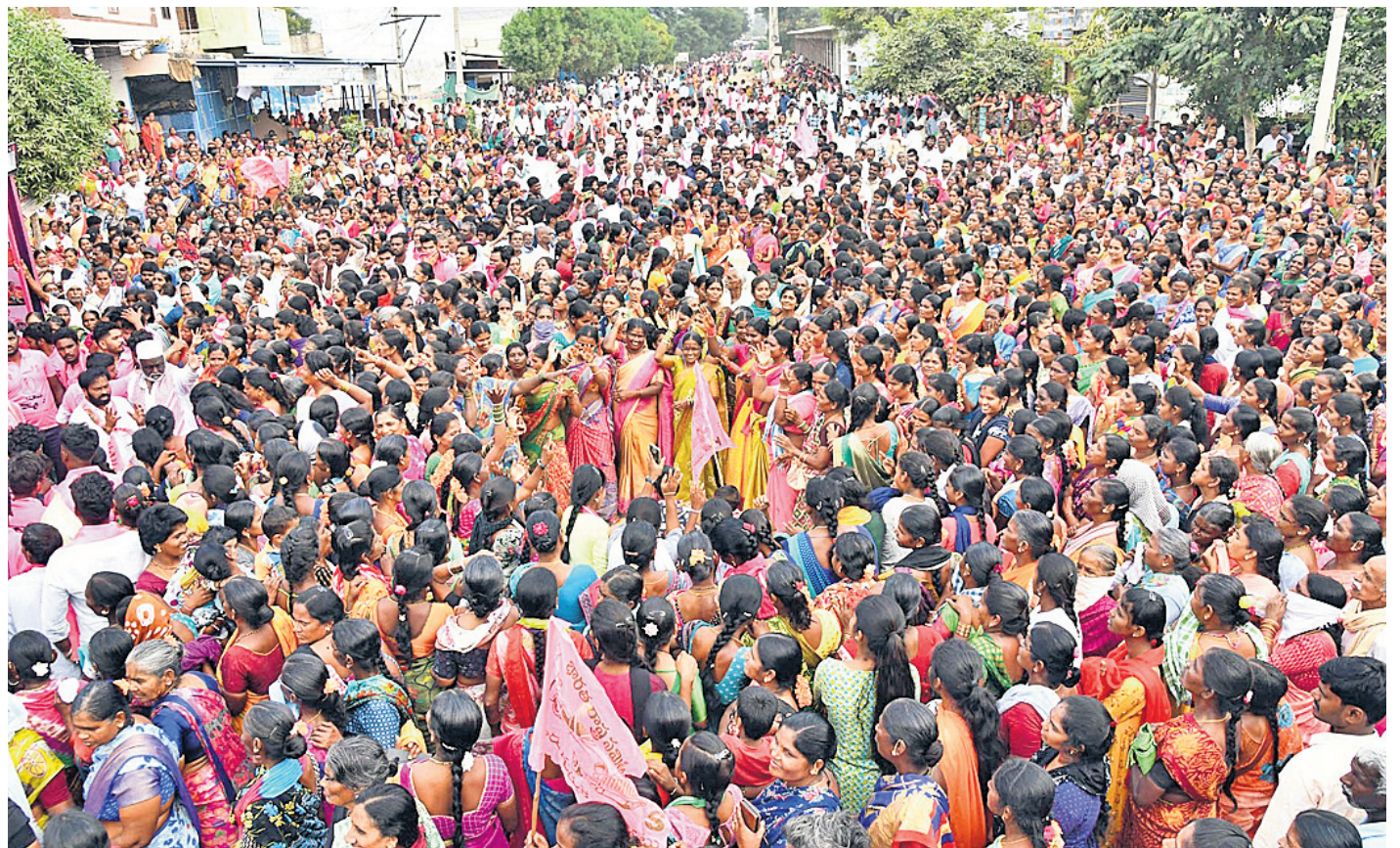
మద్దూరులో రోడ్ షోకు హాజరైన అశేష జనం