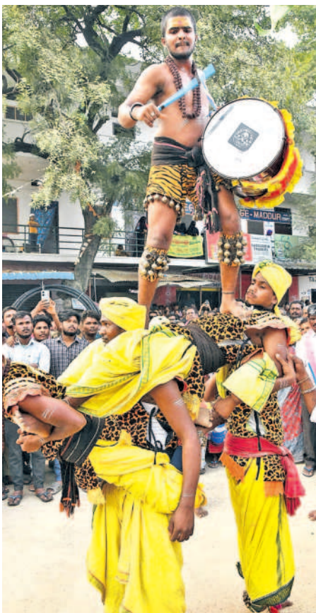
మద్దూరులో ఒక్క కళాకారుల విన్యాసాలు