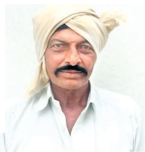
3 గంటల కరెంటుతో రైతులు అవ్వల పాలయ్యేదే..