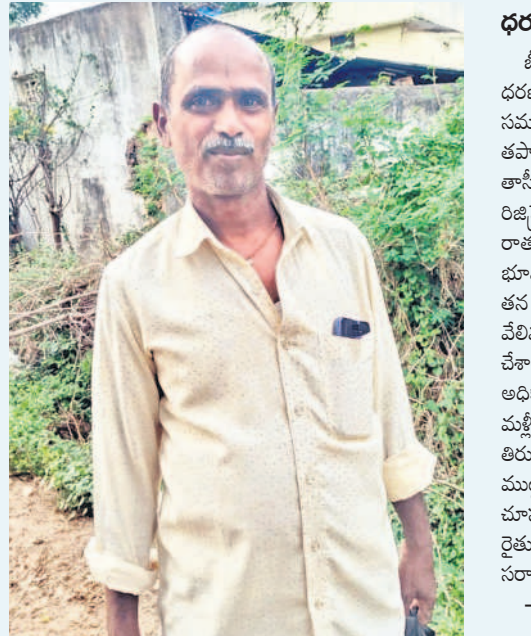
ధరణి లేకపోతే రైతులకు తిప్పలే