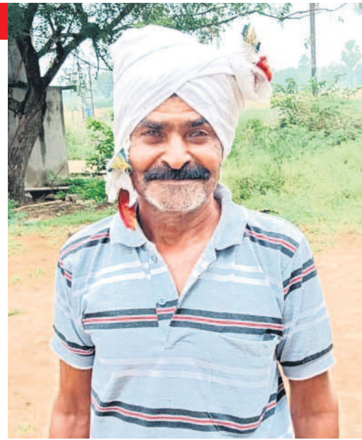
3 గంటల కరెంట్ ఇస్తే వ్యవసాయం బంద్ చేసుకోవాల్సిందే