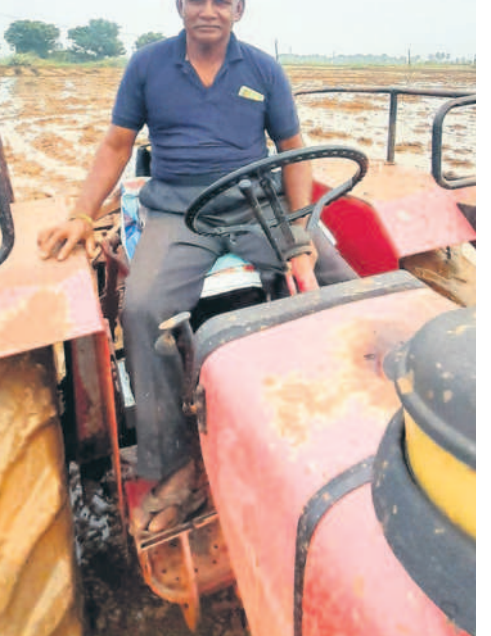
నాలుకాలు కావు.. నాణ్యమైన కరెంట్ కావాలి