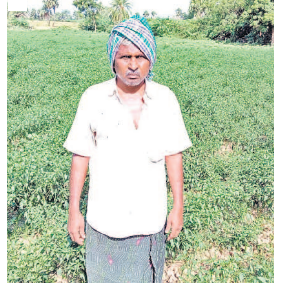
గతంలో భూముల వివరాలు సరిగ్గా లేకపోవడంతో ఇబ్బందులు ఎదురయ్యాయి. అవసరాల కోసం భూములు అమ్మాలన్నా, కొనాలన్నా తహసీల్, రిజిస్ట్రేషన్ కార్యాలయాల చుట్టూ తిరగాల్సిన పరిస్థితి ఉండేది. వైసీపీ ఇచ్చిన పని కాకపోయేది. సీఎం కేసీఆర్ భూముల రికార్డులను సరిచేసి ధరణి పోర్టల్లో సమాధులు చేయించారు. దీంతో ఇప్పుడు భూములు అమ్మాలన్నా, కొనాలన్నా ఎలాంటి ఇబ్బందులు లేవు. మీ సేవలో స్టాల్ బుక్ చేసుకున్న తర్వాత తహసీల్ కార్యాలయంలో 20 నిమిషాల్లో పని అయిపోతుంది. ధరణి మంచి సౌలభ్యం ఉన్నది.