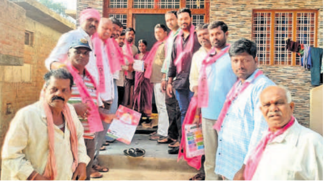
దోమ: కారు గుర్తుకు ఓటు వేయాలని కోరుతున్న నాయకులు