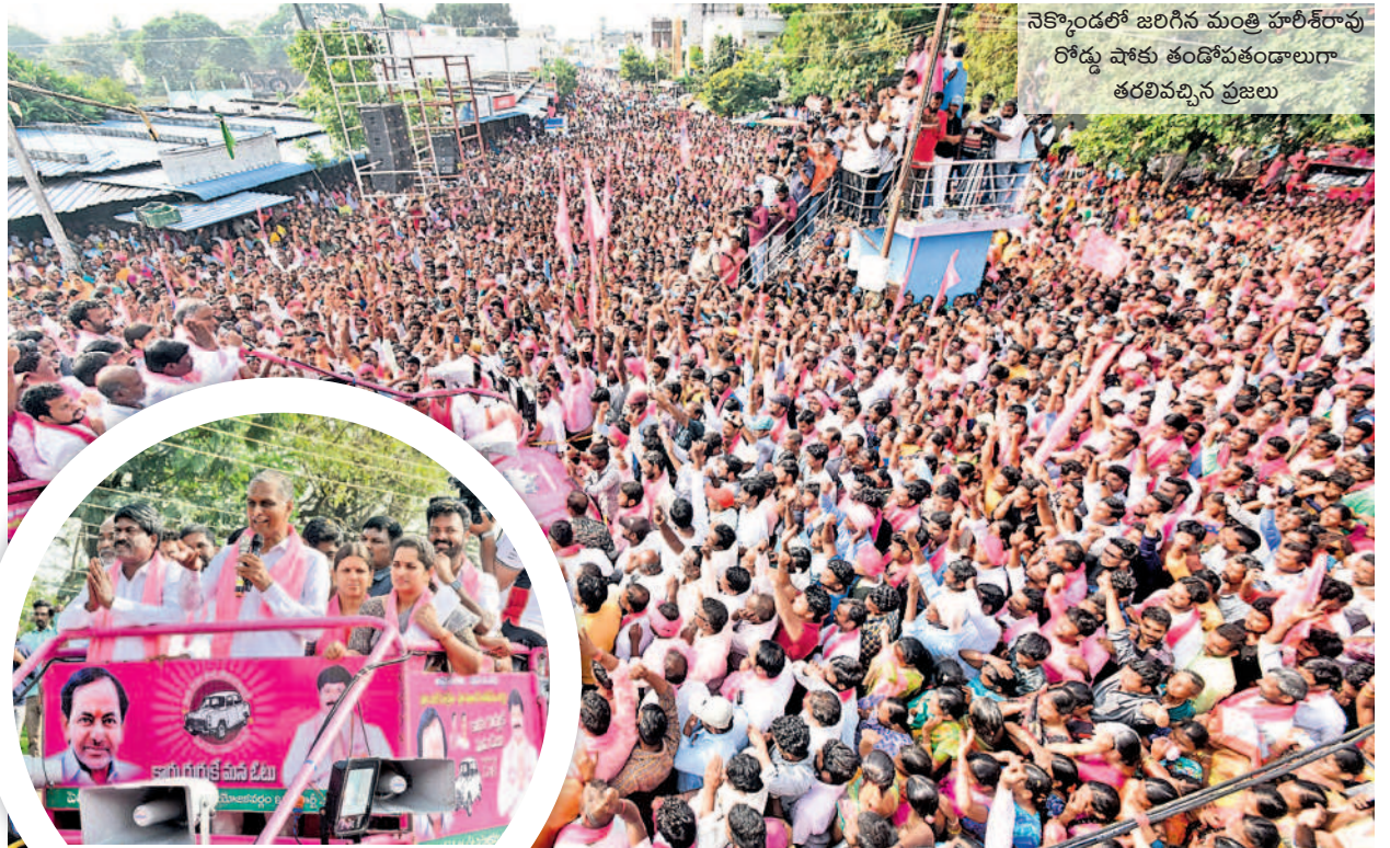
నెక్కొండలో జరిగిన మంత్రి హరీశ్ రావు రోడ్డు షోకు తండోపతండాలుగా తరలివచ్చిన ప్రజలు