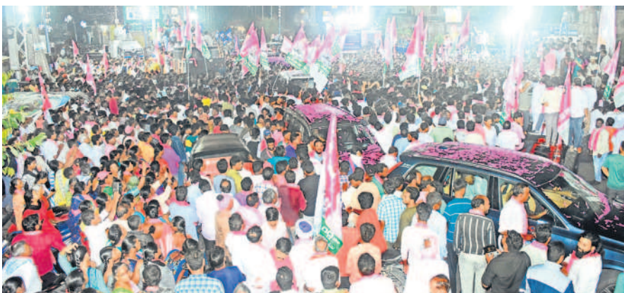
భువనగిరి బీఆర్ఎస్ రోడ్ షోకు పెద్దఎత్తున హాజరైన జనం

- యాదాద్రి భువనగిరి, నవంబర్ 25 (నమస్తే తెలంగాణ)