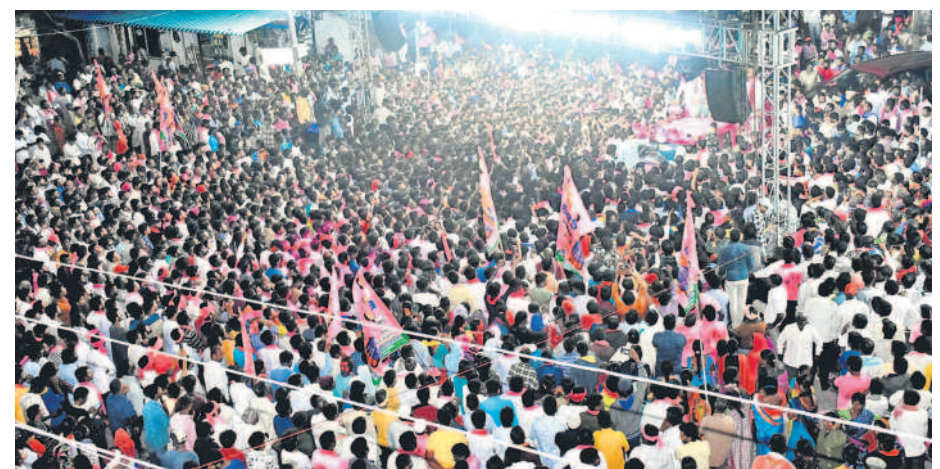
బొమ్మలరామారం మండలం చీకటిమామిడిలో బీఆర్ఎస్ రోడ్ షోకు పెద్దఎత్తున హాజరైన జనం

'పరేంట్లలో ఆలేరు నియోజకవర్గాన్ని అన్ని రంగాల్లో అభివృద్ధి చేసుకున్నాం. ఇంకా చేయాల్సింది చాలా ఉన్నది. చెల్లెమ్మ సునీతమ్మను 50 వేల మెజారిటీతో గెలిపించండి. మిగిలిన అభివృద్ధి బాధ్యత నాది' అని రాష్ట్ర ఆర్థిక, వైద్యారోగ్య శాఖల మంత్రి తన్నీరు హరీశ్ రావు అన్నారు. బొమ్మలరామారం మండలం చీకటి మామిడి గ్రామంలో శనివారం బీఆర్ఎస్ ఎమ్మెల్యే అభ్యర్థి గొంగిడి సునీతామహేందర రెడ్డికి మద్దతుగా రోడ్ షో నిర్వహించారు. ఈ సందర్భంగా హరీశ్ రావు మాట్లాడుతూ ఇప్పటికే సీఎం కేసీఆర్ ఆలేరును రెవెన్యూ డివిజన్ చేస్తారని ప్రకటించారన్నారు. యాదగిరిగుట్టలో మెడికల్ కళాశాల, నియోజకవర్గంలో గ్రీన్ ఇండస్ట్రియల్ పార్క్, ఐటీ, టూరిజం హబ్ నిర్మించాల్సి ఉన్నదని తెలిపారు. యాదగిరిగుట్ట, నవంబర్ 25