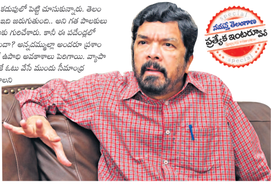
సీమాంధ్రులను కేసీఆర్ కడుపుల్లో పెట్టుకున్నారని ఓటు వేసే ముందు సిటిల్స్ ఆలోచించాలి 'నమస్తే తెలంగాణ' తో పోసాని కృష్ణమూర్తి

నీమాంధ్ర సోదరులను కేసీఆర్ కడుపుల్లో పెట్టి చూసుకున్నాడు. తెలంగాణ వస్తే అది జరుగుతుంది.. ఇది జరుగుతుంది.. అని గత పాఠకులు నీమాంధ్రులను భయభ్రాంతులకు గురిచేశారు. కానీ ఈ పదేండ్లలో అలాంటి ఘటన ఏదైనా జరిగిందా? అన్నదమ్మల్లా అందరూ ప్రశ్న తంగా ఉన్నారు. గతంలో కంటే ఉపాధి అవకాశాలు పెరిగాయి. వ్యాపారాలూ సాగుతున్నాయి. అందుకే ఓటు వేసే ముందు నీమాంధ్ర సోదరులు ఒక్కసారి ఆలోచించాలని చెబుతున్నాడు ప్రముఖ సిని నటుడు పోసాని కృష్ణమూర్తి. ఈ ప్రాంత అభివృద్ధిని కాంక్షించే వ్యక్తిగా.. అభివృద్ధిని మాత్రమే చూసే ఓటు వేస్తానని చెబుతున్న ఆయన 'నమస్తే తెలంగాణ'తో ముచ్చటించారు.