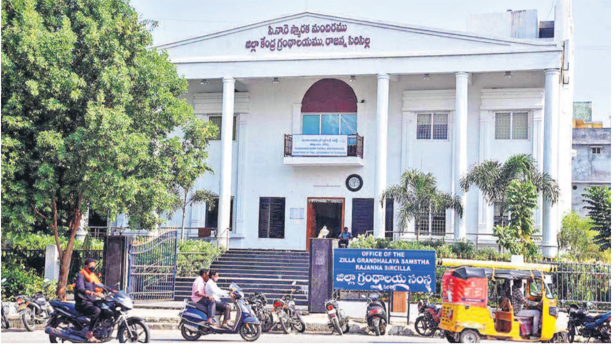
తెలుగు నుడికారాన్ని, సాంఘిక సాహిత్యాన్ని అమితంగా అభిమానించే వ్యక్తి రాష్ట్రానికి ముఖ్యమంత్రి అయ్యాక గ్రంథాలయాలకూ మహర్షి పట్టించి. ఉమ్మడి పాలనలో ఇరుకు గదిలో ఇమిడిన సినిసిల్ల గ్రంథాలయం తెలంగాణ రాష్ట్రానికి తలమానికంగా మారింది. పుస్తకాలయాలను దేవాలయాలగా భావించే కీసేఆర్ దీని బాగు కోసం 8.80 కోట్ల రూపాయలను మంజూరు చేశారు. ముంబై ఏఏఐఎల్ కి లైబ్రరరీ నమూనాగా దీన్ని తీర్చిదిద్దారు. సింప్లీ అనే, కాన్సెప్టు హాల్, డిజిటల్ లైబ్రరీ, వందలాది పుస్తకాలతో ఇప్పుడిది కొలుపుదీరింది. జిల్లాకు చెందిన ప్రముఖ కవి సి.నారాయణరెడ్డి పేరిట దీనికి సినారె స్మారక మందిరంగా నామకరణం చేశారు.