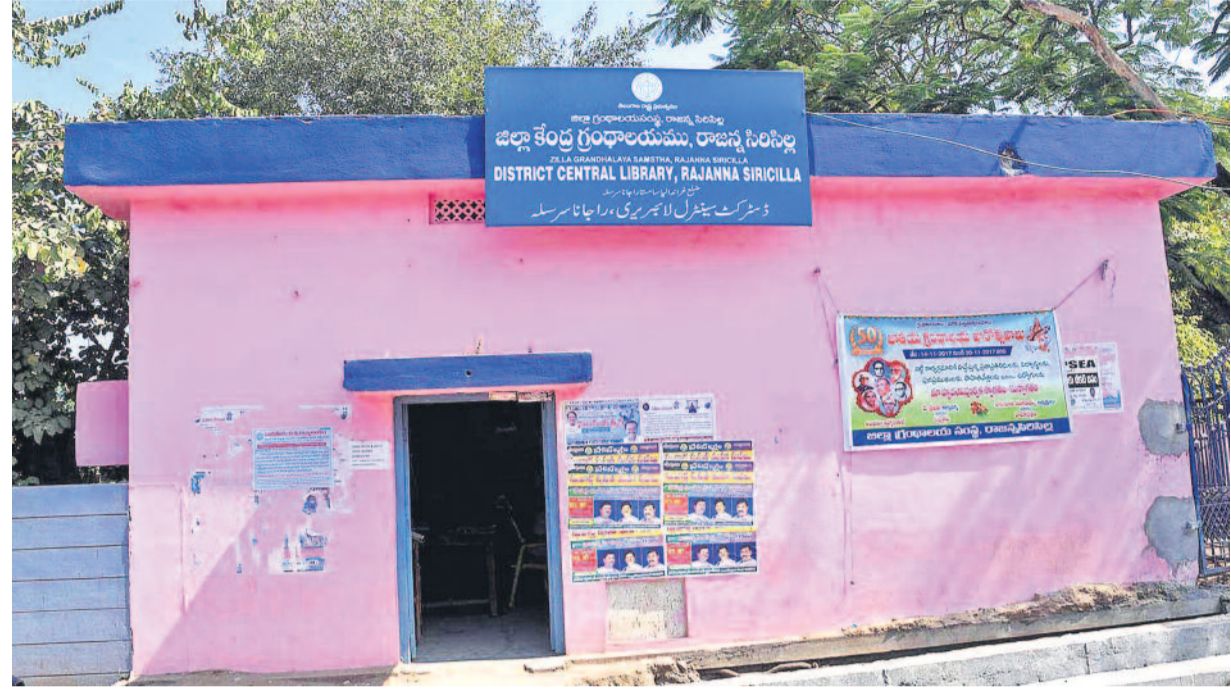
సినిసిల్ల పట్టణంలో దశాబ్దాల క్రితం ఏర్పాటు చేసిన గ్రంథాలయం ఇది. ఇక్కడ నామమాత్రంగా ఏవో కొన్ని పాఠ్యపుస్తకాలు, రెండు మూడు సాహితీ రచనలు, ఒకటిరెండు దినపత్రికలు మాత్రమే అందుబాటులో ఉండేవి. ఇక్కడి భవనం కూడా శిథిలావస్థకు చేరింది. స్టాఫ్ పెళ్లవులు సందర్భాలు అనేకం. వద్దం పడిందంటే ఆ రోజు లైబ్రరరీ సెలవే. అక్కడిదాకా వచ్చిన పఠనాభిలాషులు ఉసురుమంటూ తిరుగుముఖం పట్టేవారు. గ్రంథాలయాల అభివృద్ధి గురించి అప్పటి రాష్ట్ర ప్రభుత్వాలకు కనీసం వట్టింపుకోకపోవడమే ఈ దుస్థితికి కారణం.