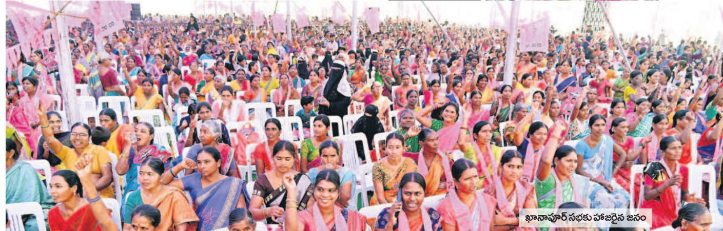
ఖానాపూర్ సభకు హాజరైన జనం