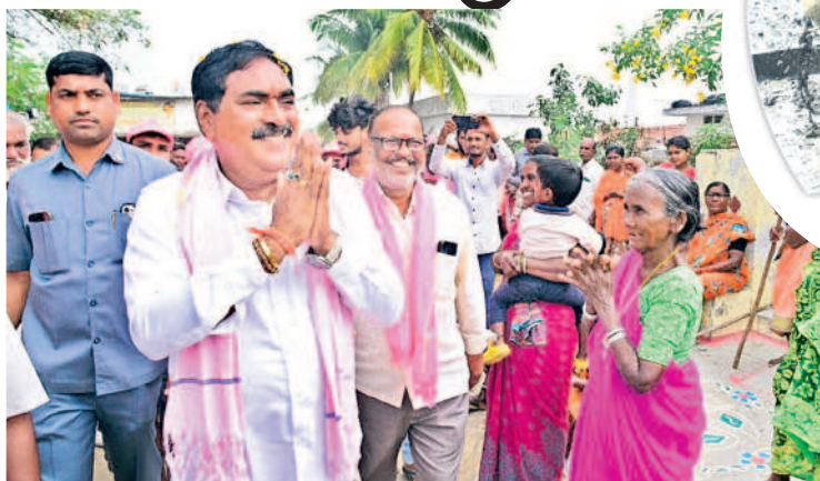
పాలకుల్ని మండలం కోతులబాద్ లో ఎన్నికల ప్రచారం నిర్వహిస్తున్న మంత్రి ఎర్రబెల్లి దయాకర్ రావు