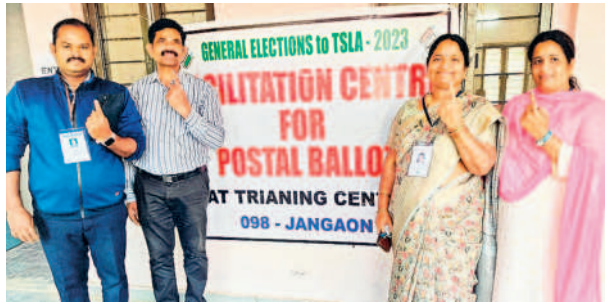
ఏబీవీ డిగ్రీ కాలేజీలో పోస్టల్ బ్యాలెట్ ద్వారా ఓటు వేసిన అధికారులు

జనగామ చౌరస్తా, నవంబర్ 26 : టీ-పీసీసీ అధ్యక్షుడు రేవంత్ రెడ్డిపై జనగామ పీఎస్ లో కేసు నమోదు చేసినట్లు అర్చన సీబి ఎలబోయిన శ్రీనివాస్ తెలిపారు. సీబి తెలిపిన వివరాల ప్రకారం.. ఈ నెల 15వ తేదీన జనగామ అసెంబ్లీ నియోజకవర్గ ఎన్నికల ప్రచారంలో భాగంగా టీ-పీసీసీ అధ్యక్షుడు రేవంత్ రెడ్డి సీఎం అధికారిక నివాసం ప్రగతి భవన్ ను బాంబులతో పేల్చివేయాలని వ్యాఖ్యలు చేశారు. సీఎం కేసీ ఆర్, మంత్రి కేటీఆర్ 150 పడక గదుల రాజభవన గృహాన్ని రూ.2 వేల కోట్లతో నిర్మించారని ఆరోపిస్తూ సీఎం కేసీఆర్ ను అవమానించే విధంగా వ్యాఖ్యలు చేశారు. అదేవిధంగా ప్రగతి భవన్ లోకి తెలంగాణ వాళ్లకు ప్రవేశం లేదు, గద్దరన్నకు ప్రవేశం లేదు, దళితులకు ప్రవేశం లేదు, ఆదివాసీలు, తెలంగాణ విద్యార్థులకు ప్రవేశం లేదు, నిరుద్యోగులకు ప్రవేశం లేదు, ప్రజా ప్రతినిధులకు ప్రవేశం లేదన్నారు. ప్రజల పక్షాన పోరాడుతున్న కామ్రేడ్ బ్రదర్స్ (కమ్యూనిస్టు పార్టీలు)కు కూడా ప్రవేశం లేదన్న రేవంత్ రెడ్డి వ్యాఖ్యలపై బీఆర్ఎస్ రాష్ట్ర ప్రధాన కార్యదర్శి సోమ భరత్ కుమార్ భారత ఎన్నికల సంఘం అధికారులకు ఫిర్యాదు చేశారు. జనగామ అసెంబ్లీ ఎన్నికల రిటర్నింగ్ అధికారి ఇచ్చిన ఉత్తర్వుల మేరకు టీ-పీసీసీ అధ్యక్షుడు రేవంత్ రెడ్డిపై అర్చన పీఎస్ లో కేసు నమోదు చేసినట్లు సీబి శ్రీనివాస్ పేర్కొన్నారు.