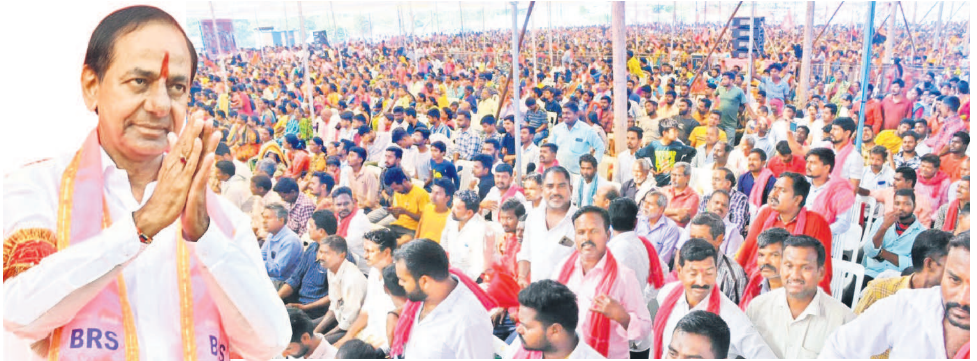
జగిత్యాలలో ప్రజా ఆశీర్వాద సభకు హాజరైన ప్రజలు, అభివాదం చేస్తున్న ముఖ్యమంత్రి కేసీఆర్