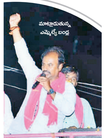
మాట్లాడుతున్న ఎమ్మెల్యే బండ్ల