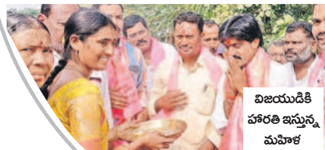
విజయూడికి హారతి ఇస్తున్న మహిళ