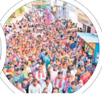
ప్రచారంలో పాల్గొన్న మహిళలు