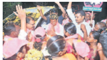
హారతి ఇచ్చి స్వాగతం పలుకుతున్న మహిళలు