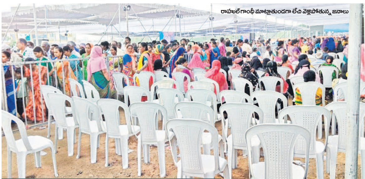
రాహుల్ గాంధీ మాట్లాడుతుండగా లేచి వెళ్లిపోతున్న జనాలు