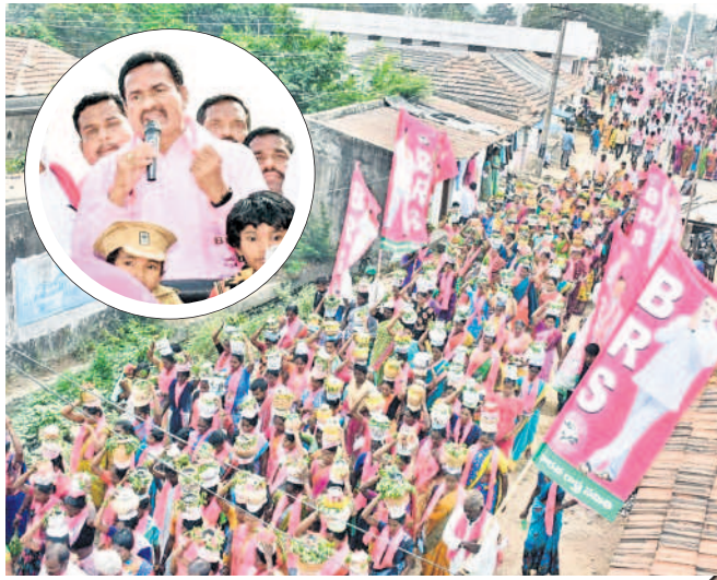
భవానీపేటలో బీఆర్ఎస్ ప్రధానానికి బోనాలతో తరలివచ్చిన మహిళలు