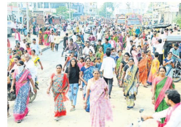
కదిలింది మహిళా లోకం: ప్రజా ఆశీర్వాద సభకు తరలివస్తున్న మహిళలు

- మంచీర్యాల, నవంబర్ 26 (నమస్తే తెలంగాణ ప్రతినిధి)