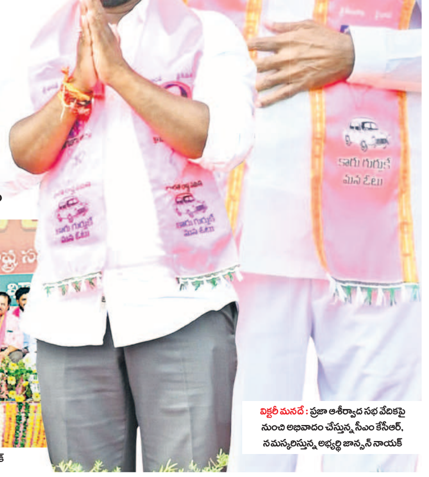
చిక్కిరించిన: ప్రజా ఆశీర్వాద సభ వేదికపై నుంచి అభివాదం చేస్తున్న సీఎం కేసీఆర్, నమస్కరిస్తున్న అభ్యర్థి జాన్సన్ నాయక్