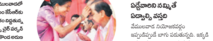
వేములవాడలో సీఎం కేసీఆర్ కు వీరతిలకం దిద్దటాన్ని జడ్పీ చైర్ వర్మన్ న్యాలకొండ అరుణ