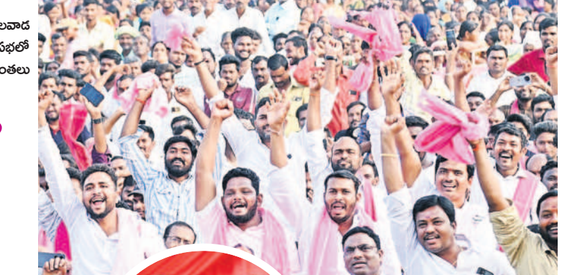
వేములవాడ సభలో కేంకలు

ఎందుకు తెచ్చామో..? దానికోసం ఎంత సాధన చేశామో చెప్పిన ముఖ్యమంత్రి, కాంగ్రెస్ వాళ్ళ వస్తే ధరణిని బంగాళాఖాతంలో వేస్తా మంటున్నారు. ధరణి ఉండాలా..? వద్దా..? మీరే చెప్పాలంటూ ప్రశ్నించగా, సభలోని జనం అంతా ఒక్కసారిగా చేతులెత్తి ఉండా అంటూ నినాదాలు ఇచ్చారు. 24 గంటల కంటే మించిన అవసరం లేదని కాంగ్రెస్ వాళ్ళు చెబుతున్నారని, నిజంగా మీకు అవసరం లేదా..? అని అడుగగా.. తమకు ఉండాలి అంటూ చెబుతూనే, 'జై కేసీఆర్' అంటూ నినదించారు. రైతుబంధును పుల్లించిందే కేసీ ఆర్, అది వృధా అంటున్నారని కాంగ్రెస్ వాళ్ళు.. నిజంగా వృధా యేనా..? మీరు చెప్పాలంటూ ముఖ్యమంత్రి ప్రశ్నించగా, 'వృధా కాదు' అంటూ స్పష్టం చేశారు. రైతాంగానికి ఇంకా చేయాల్సినది ఎంతో ఉందని, ప్రభుత్వం రాగానే ఇప్పుడున్న రైతు బంధును ఎక రాకు రూ.18వేలకు పెంచుతామని ప్రకటించగా, 'జై కేసీఆర్' అంటూ నలుదిక్కులు పిక్కటిల్లేలా చప్పుట్లు కొట్టారు. ఓటు మీ వజ్రా యుధమని, ఆలోచించి ఓటువేయాలని వివరించిన తీరు, ప్రజలను ఆకట్టుకుంది. ఏ మాత్రం ఏమరపాటుకో గానీ, సెంటిమెంట్లకు లొంగి ఓటిసినా ఆ తర్వాత జరిగే పరిణామాలను ముఖ్యమంత్రి క్లుప్తంగా వివరించి చెప్పారు. ప్రధానంగా యాభై ఏండ్ల కాంగ్రెస్ పాలనలో జరిగిన అభివృద్ధి, పదేండ్ల బీఆర్ఎస్ పాలనలో జరిగిన అభివృద్ధిపై గ్రామాల్లో చర్చపెట్టాలని, ఆలోచించి ఓటు వేయాలని కోరారు.