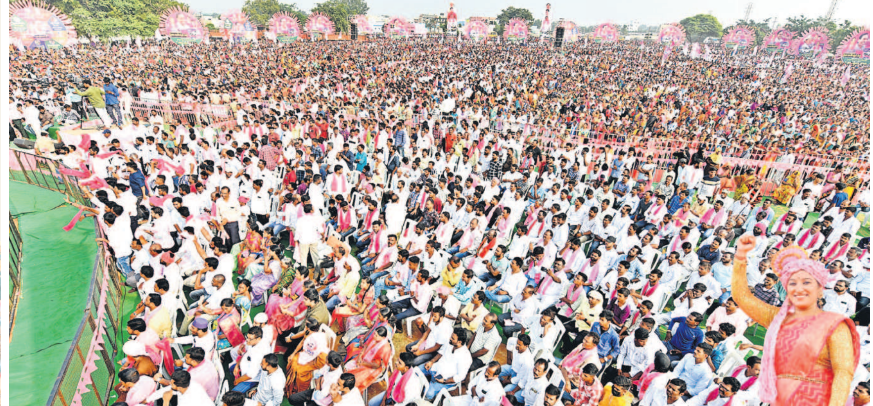
వేములవాడ ప్రజా ఆశీర్వాద సభకు అశేషంగా తరలివచ్చిన ప్రజానీకం

బీఆర్ఎస్ గెలుపు కాంగ్రెస్ పన్నెండు మంది ముఖ్యమంత్రులు ఉన్నరు. ఎవరు ముఖ్యమంత్రి అయితే వాళ్ళే తెల్లది. వాడు గెలిచేది లేదు.. సన్నెలి లేదు. మనమే బ్రహ్మాండమైన మెజారిటీతో గెలుస్తున్నం. అందులో అనుమానం లేదు. గాలి లేదు గత్తర లేదు. ఉన్నకాడికి బీఆర్ఎస్ దే గాలి ఉన్నది. ఇప్పటికీ 86 సభల్లో పాల్గొన్న రేపు, ఎల్లూడి నా ప్రచారం కంప్లీట్ అయితేది. ఏనుగెల్లింది.. తోక చిక్కింది. ఇవాళ జగిత్యాలలో చెబుతున్న మళ్ళీ పచ్చిననాడు యాది చెప్పి. పండ్లశాతం భయంకరమైన మెజార్టీతో బీఆర్ఎస్ గవర్నమెంట్ వస్తుంది. - ముఖ్యమంత్రి కేసీఆర్