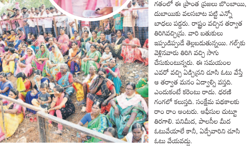
వేములవాడలో సీఎం ప్రసంగాన్ని వింటున్న మహిళలు