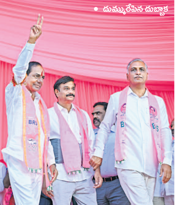
• దుమ్మురేపిన దుబ్బాక