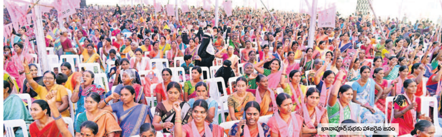
ఖానాపూర్ సభకు హాజరైన జనం