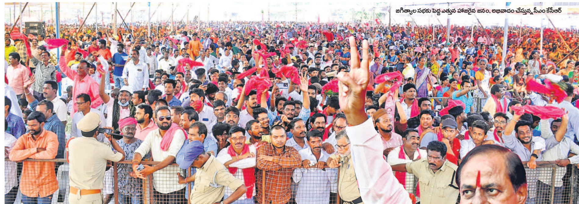
జగిత్యాల సభకు పెద్ద ఎత్తున హాజరైన జనం, అభివాదం చేస్తున్న సీఎం కేసీఆర్