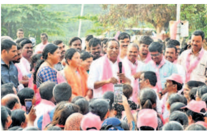
రాంపల్లి దాయలలో మాట్లాడుతున్న మంత్రి మల్లారెడ్డి

మేడ్చల్ మండలంలో నిర్వహించిన ప్రచారంలో పాల్గొన్న మంత్రి మల్లారెడ్డికి గ్రామాల్లో ప్రజలు ఘన