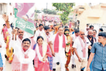
మేడ్చల్ మండలంలోని శ్రీరంగవరం గ్రామంలో ప్రచారంలో పాల్గొన్న మంత్రి మల్లారెడ్డి