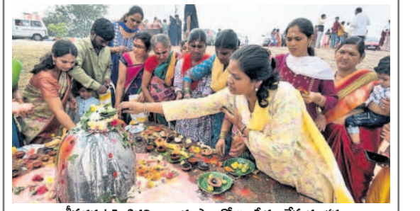
కీసరగుట్టపై శివలింగాలకు పాలతో అభిషేకం చేస్తున్న భక్తులు

కీసర, నవంబర్ 26: కీసరగుట్ట శ్రీ భవానీ రామలింగేశ్వరస్వామి ఆలయం ఆదివారం భక్తులతో కిటకిటలాడిపోయింది. గర్భాలయంలో స్వామివారికి మహానానా పూర్వక రుద్రాభిషేకాన్ని నిర్వహించారు. వేద పండితుల మంత్రోచ్ఛరణల మధ్య స్వామివారికి భక్తులు ప్రత్యేక అభిషేకాలను నిర్వహించారు. మహిళా భక్తులు అధిక సంఖ్యలో విచ్చేసి కార్తీకదీపాలను వెలిగించి మొక్కులను తీర్చుకున్నారు. అదేవిధంగా చిర్యాల శ్రీ లక్ష్మీ నర్సింహస్వామి ఆలయంలో ఘనంగా సత్యనారాయణవ్రతాల వేడుకలను భక్తులు నిర్వహించారు.