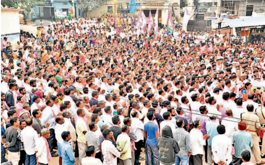
మేడ్చల్ మండలంలోని డబిల్ పూర్ లో మంత్రి మల్లారెడ్డి ప్రచారంలో పాల్గొన్న నాయకులు, ప్రజలు