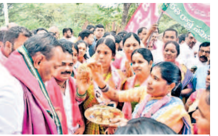
మేడ్చల్ మండలంలోని గొడవెల్లి గ్రామంలో మంత్రి మల్లారెడ్డికి హారతి పడుతున్న మహిళలు

మేడ్చల్ రూరల్, నవంబర్ 26: తెలంగాణ అభివృద్ధి బీఆర్ఎస్ తోనే సాధ్యమని, ఎన్నికల్లో ప్రతి ఒక్కరూ కారు గుర్తుకు ఓటు వేసి గెలిపించండి మరింత అభివృద్ధి చేసి రుణం తీర్చుకుంటానని బీఆర్ఎస్ ఎమ్మెల్యే అభ్యర్థి, మంత్రి మల్లారెడ్డి అన్నారు. ఎన్నికల ప్రచారంలో భాగంగా మేడ్చల్ మండలంలోని గొడవెల్లి, రాయిలా పూర్, శ్రీరంగవరం, డబిల్ పూర్ గ్రామాల్లో ఆదివారం ర్యాలీ, కార్వర్ మీటింగ్ లు నిర్వహించారు. ఈ కార్యక్రమంలో పాల్గొన్న మంత్రి మాట్లాడుతూ సీఎం కేసీఆర్ తెలంగాణను దేశంలోనే అభివృద్ధి చెందిన రాష్ట్రంగా తీర్చి దిద్దారని తెలిపారు. ఓట్లు దండకోవడానికి వస్తున్న కాంగ్రెస్ నాయకుల మాటలు నమ్మి మోసపోవద్దన్నారు. మరోమారు గెలిపిస్తే గ్యారంటీ సిలిండర్ ను రూ. 400కు, పింఛన్ను రూ. 5వేలవరకు, రైతు బంధు రూ. 15 వేలు,