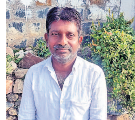
ధరణి పోతే రైతులకు గోస..

తెలంగాణ ప్రభుత్వం వ్యవసాయం చేసుకోవడానికి రైతులకు ఉచితంగా 24 గంటల పాటు ఇస్తున్న కరెంటుతో ఎవుసం సంతోషంగా వేసుకుంటున్నాం. ఒకప్పుటి బీడు భూములు కూడా ఇప్పుడు సాగు భూములుగా మారాయి. అందుకే మళ్ళీ బీఆర్ఎస్ నే గెలిపించుకుంటాం. బూటకపు మాటలను నిండా ముంచాలని మాస్టు లేవంకెరెడ్డికి తగిన గుణపాఠం చెబుతాం. సీఎం కేసీఆర్ ఆరునెలలకో మారు రైతుల ఖాతాల్లో డబ్బులు మేస్తుంటే ఓర్వలేక నిస్సహాయ స్థితిలో ఉన్న రేవంత్ ఇలాంటి గారడి మాటలు మాట్లాడడం మానుకోవాలి. పౌరపాలన కాంగ్రెస్ వచ్చిందంటే.. రైతుల బతుకులు ఆగమవుతాయి. కిషన్ రైతు రామాయంపేట