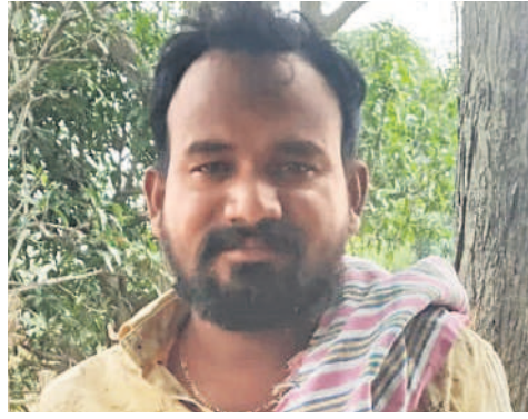
దేశానికే అన్నపూర్ణగా అవతరించింది..

తెలంగాణలో రైతులకు 24 గంటల ఉచిత కరెంటుతో చాలా ప్రాధాన్యత ఉంది. వ్యవసాయ పంటలకు నీరు సరఫరా చేస్తూ పంటలు పండించుకుంటున్నాం. తెలంగాణ రాష్ట్రానికే కాక దేశానికీ అన్నపూర్ణగా ఆవిర్భవించింది. రాత్రి, పగలు వెలుగులు నిండజున్నాయి. రాత్రి కూడా నిరంతరం కరెంటు సరఫరాతో సంతోషంగా ఉన్నాం. వ్యాపార, వాణిజ్య, పరిశ్రమ వర్గాలు జీవనోపాధిని కల్పిస్తూ ముందుకెళ్తుంది. కాంగ్రెస్ అధికారంలోకి వస్తే అందకారమే..