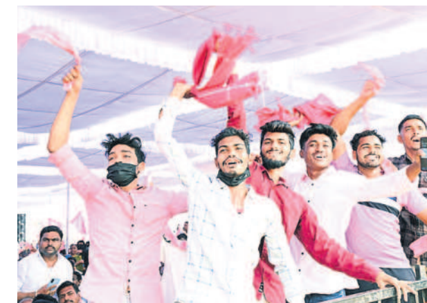
జెండెక్కి, జై కొట్టి: గులాబీ జెండ్లాలు ఊపుతూ నృత్యం చేస్తున్న యువకులు