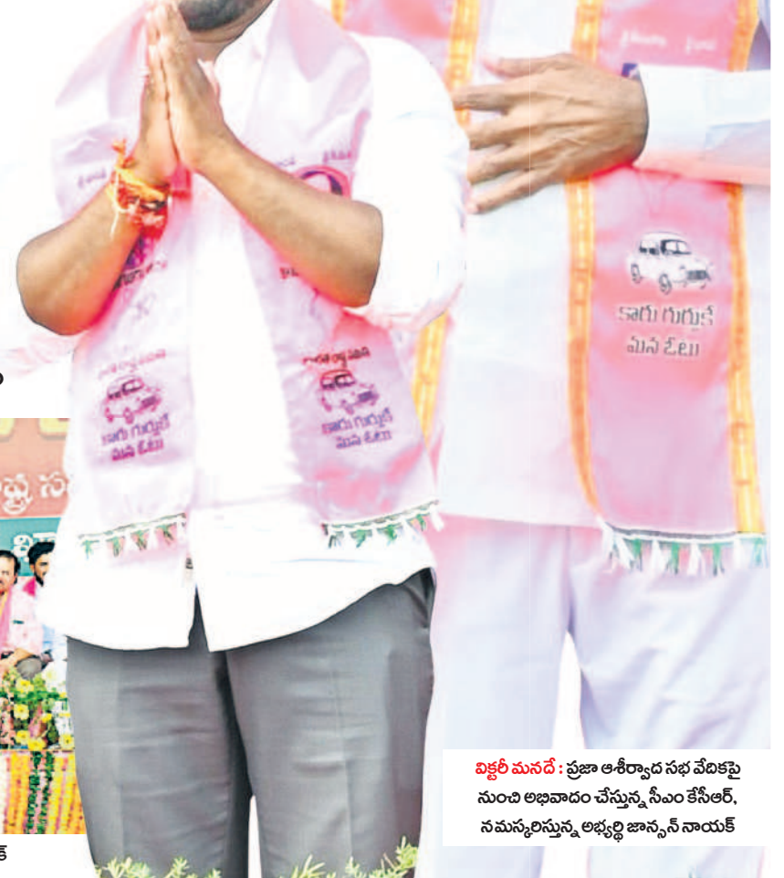
చిక్కరి మనదే: ప్రజా ఆశీర్వాద సభ వేదికపై నుంచి అభివాదం చేస్తున్న సీఎం కేసీఆర్, నమస్కరిస్తున్న అభ్యర్థి జాన్సన్ నాయక్