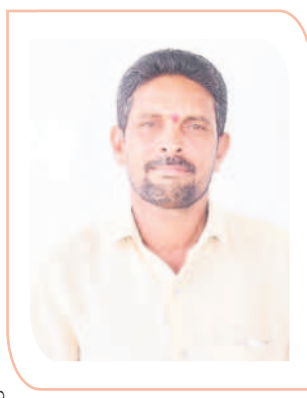
-నల్లాల పోచం, మల్లంపేట, (కోటపల్లి)

కోటపల్లి, నవంబర్ 26 : పచ్చగా ఉన్న తెలంగాణలో రైతుల మధ్య చిచ్చు పెట్టి రాక్షసానందం పొందాలని కాంగ్రెస్ పార్టీ చూస్తోంది. రైతు బంధు భూమి యజమానికి ఇస్తే కౌలుదారు డికి ఇవ్వమని, కౌలు రైతుకు ఇస్తే భూమి యజమానికి ఇవ్వమని రేవంత్ రెడ్డి చెప్పి ఎన్నికలకు ముందే రైతుల మధ్య కొట్లాట పెట్టాలని చూస్తున్నాడు. కౌలు రైతులకే రైతు బంధు ఇవ్వడం ద్వారా పట్టాదారుడు ఆ భూమిపై హక్కులు కోల్పోయే ప్రమాదం ఉంది. కాంగ్రెస్ అధికారంలోకి రాకముందే రెండు నాలుకల ధోరణితో రైతులను ఇబ్బంది దులు పెట్టాలని చూస్తోంది. కాంగ్రెస్ కు తెలంగాణలో రైతులు బాగుపడడం ఇష్టం లేక ఇలా రకరకాల ప్రకటనలు చేస్తూ మోసం చేయాలని చూస్తోంది. రైతుబంధుపై స్పష్టమైన విధానంతో ముందుకెళ్తున్న కేసీఆర్ వెంటే మేమంతా ఉంటం. అసలు డిల్లీ లీడర్లకు తలోగ్గి మాట్లాడే ఈ కాంగ్రెస్ నోళ్లను ప్రజలవరూ నమ్మరు. వాళ్లయ్యన్నీ అబద్ధాలే. ప్రజలకు మంచి జేసుకుంటే వాళ్లతోని కాదు. ఉత్త ముచ్చట్లు అన్నీ చెబుతారు. ఆరు గ్యారంటీల్లో ఒక్క గ్యారంటీ మీద అప్పుడే యూటర్న్ తీసుకున్నారు. ఇగ మిగతాం కూడా రేపో, ఎల్లండో బయట పడుతారు.