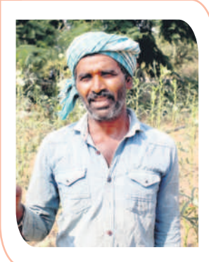
- లింగన్న, రైతు, కజ్జర్ల, తలమడుగు మండలం

రైతులకు మాయమాటలు చెప్పి ఓట్లు దండుకుని మోసం చేయడం కాంగ్రెస్ నైజం. ఉమ్మడి రాష్ట్రంలో కాంగ్రెస్ ప్రభుత్వం అధికారంలో ఉన్నప్పుడు రైతులు పడ్డ కష్టాలు అన్నీ, ఇన్నీ కావు. విత్తనాలు, మందు బస్తాలకోసం పోలీసుల లాఠీ దెబ్బలు తినాల్సి వచ్చేది. పంట పెట్టు బడులు లేక అప్పులు చేసేటోళ్ళం. కరెంటు లేక చేతికి వచ్చిన పంటలు నష్టపోవాల్సి వచ్చి అప్పులు తీర్చలేని పరిస్థితి ఉండేది. రైతుల ఇబ్బందులను దూరం చేయాలని నాయకులను కోరినా ఫలితం మాత్రం శూన్యం. రైతుబిడ్డ కేసీఆర్ దేశంలో ఎక్కడా లేని విధంగా ఎన్నో పథకాలను అమలు చేసి రైతులకు పెద్దన్నలా ఉంటున్నాడు. వ్యవసాయం బాగుపడాలంటే ఏమి చేయాలో ఆయనకు బాగా తెలుసు. రైతులకు ఎకరాకు రూ. 15 వేలు, కౌలు రైతులకు రూ. 15 వేలు ఇస్తామని చెప్పిన కాంగ్రెస్ నాయకులు ఇప్పుడు మాట మార్చారు. ఎవరికో ఒకరికి మాత్రమే రూ.15 వేలు ఇస్తామని రేవంత్ రెడ్డి అనడం నిజస్వరూపాన్ని బయటపెట్టింది. గిప్పుడే మాటలు మారుస్తున్నారు. గీళ్లను నమ్మితే నిండా మునుగుతం.