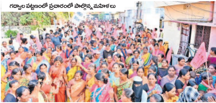
గద్వాల పట్టణంలో ప్రచారంలో పాల్గొన్న మహిళలు