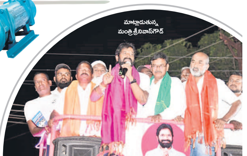
మాట్లాడుతున్న మంత్రి శ్రీనివాస్ గౌడ్