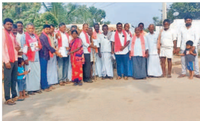
పాన్ గల్ : దవాజీపల్లిలో కారు గుర్తుకు ఓటియాలని అభ్యర్థిస్తున్న బీఆర్ఎస్ వ్రేణులు