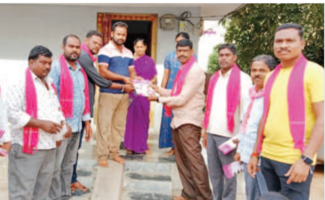
పెంట్ల వెళ్లి: మండల కేంద్రంలో ఎన్నికల ప్రచారం నిర్వహిస్తున్న బీఆర్ఎస్ కార్యకర్తలు