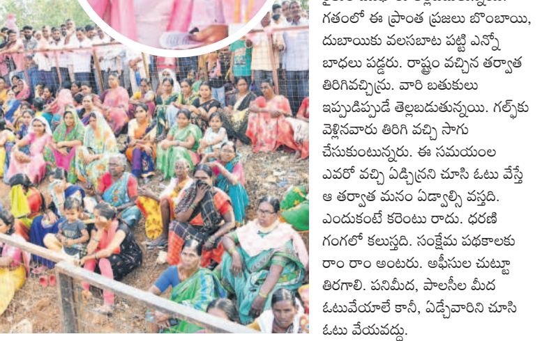
వేములవాడలో సీఎం ప్రసంగాన్ని వింటున్న మహిళలు