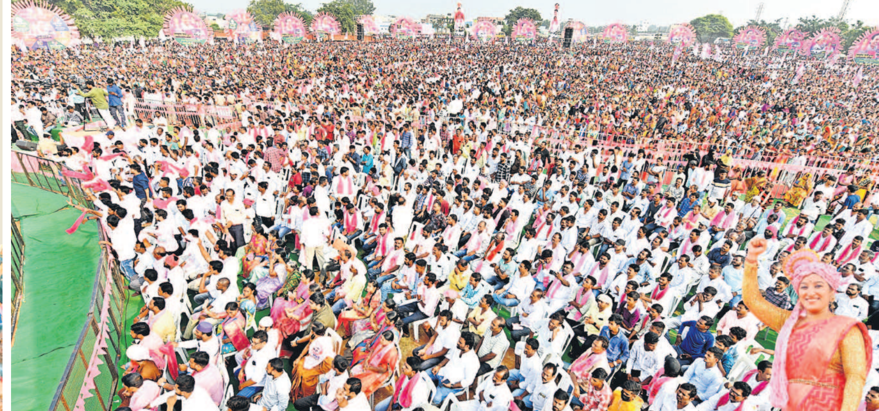
వేములవాడ ప్రజా ఆశీర్వాద సభకు అశేషంగా తరలివచ్చిన ప్రజానీకం

బీఆర్ఎస్ గెలుపు కాంగ్రెస్ పన్నెండు మంది ముఖ్యమంత్రులు ఉన్నారే. ఎవరు ముఖ్యమంత్రి అయితే వాళ్ళే తెలుగు. వాడు గెలిచేది లేదు.. సన్నెలి లేదు. మనమే బ్రహ్మాండమైన మెజారిటీతో గెలుస్తున్నాం. అందులో అనుమానం లేదు. గాలి లేదు గత్తర లేదు. ఉన్నకాడికి బీఆర్ఎస్ దే గాలి ఉన్నది. ఇప్పటికీ 86 సభల్లో పాల్గొన్న రేపు, ఎల్లండి నా ప్రచారం కంప్లీట్ అయితేది. ఏనుగెల్లింది.. తోక చిక్కింది. ఇవాళ జగిత్యాలలో చెబుతున్న మళ్ళీ పచ్చిననాడు యాది చెప్పి. పండ్లకాశం భయంకరమైన మెజార్టీతో బీఆర్ఎస్ గెలుపుమొందే వస్తుంది. - ముఖ్యమంత్రి కేసీఆర్