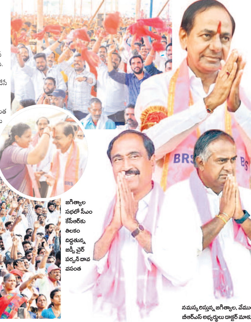
జగిత్యాల సభలో సీఎం కేసీఆర్ కు తిలకం దిద్దటాన్ని జడ్పీ చైర్ వర్మన్ దావ పనంత్