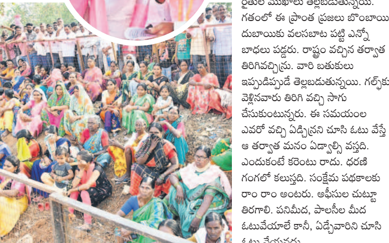
వేములవాడలో సీఎం ప్రసంగాన్ని వింటున్న మహిళలు