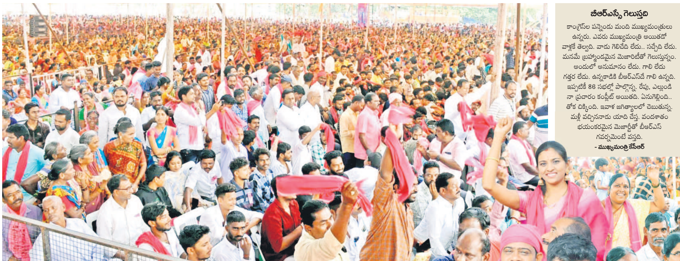
జగిత్యాల ప్రజా ఆశీర్వాద సభకు అశేషంగా హాజరైన జనం, గులాబీ జెండాలు ఊపుతూ కేరింకలు