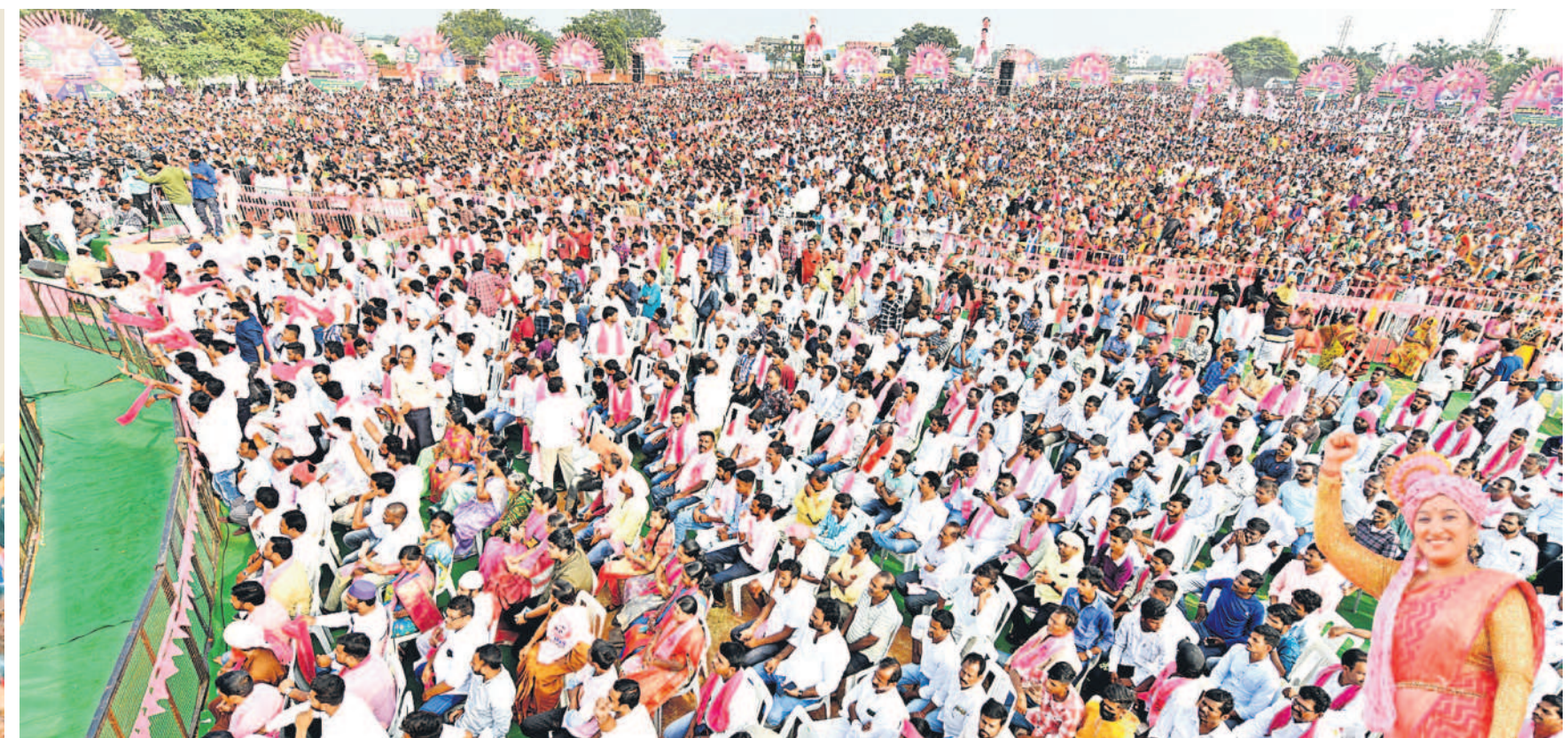
వేములవాడ ప్రజా ఆశీర్వాద సభకు అశేషంగా తరలివచ్చిన ప్రజానీకం

బీఆర్ఎస్ గెలుపు కాంగ్రెస్ పన్నెండు మంది ముఖ్యమంత్రులు ఉన్నారని. ఎవరు ముఖ్యమంత్రి అయితే వాళ్ళే తెల్లని. వాడు గెలిచేది లేదు.. సన్నెలి లేదు. మనమే బ్రహ్మాండమైన మెజారిటీతో గెలుస్తున్నం. అందులో అనుమానం లేదు. గాలి లేదు గత్తర లేదు. ఉన్నకాడికి బీఆర్ఎస్ దే గాలి ఉన్నది. ఇప్పటికీ 86 సభల్లో పాల్గొన్న రేపు, ఎల్లండ్డి నా ప్రచారం కంప్లీట్ అయితేది. ఏనుగెల్లింది.. తోక చిక్కింది. ఇవాళ జగిత్యాలలో చెబుతున్న మళ్ళీ పచ్చిననాడు యాది చెప్పి. పండ్లకాతం భయంకరమైన మెజార్టీతో బీఆర్ఎస్ గెలుపుమొందే వస్తుంది. - ముఖ్యమంత్రి కేసీఆర్