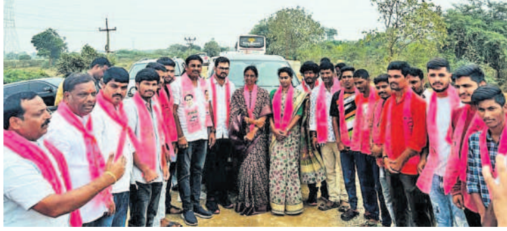
విద్యాశాఖ మంత్రి సబితా ఇంద్రారెడ్డి సమక్షంలో బీఆర్ఎస్ పార్టీలో చేరిన రామారావు తండాకు చెందిన బీజేపీ నాయకులు

మహేశ్వరం, సెప్టెంబర్ 26: తెలంగాణకు బీఆర్ఎస్ తోనే ఉజ్వల భవిష్యత్తు ఉందని బీఆర్ఎస్ పార్టీ ఎమ్మెల్యే అభ్యర్థి, రాష్ట్ర విద్యాశాఖ మంత్రి సబితా ఇంద్రారెడ్డి అన్నారు. ఆదివారం మండల పరిధిలోని రామారావు తండాకు చెందిన 30