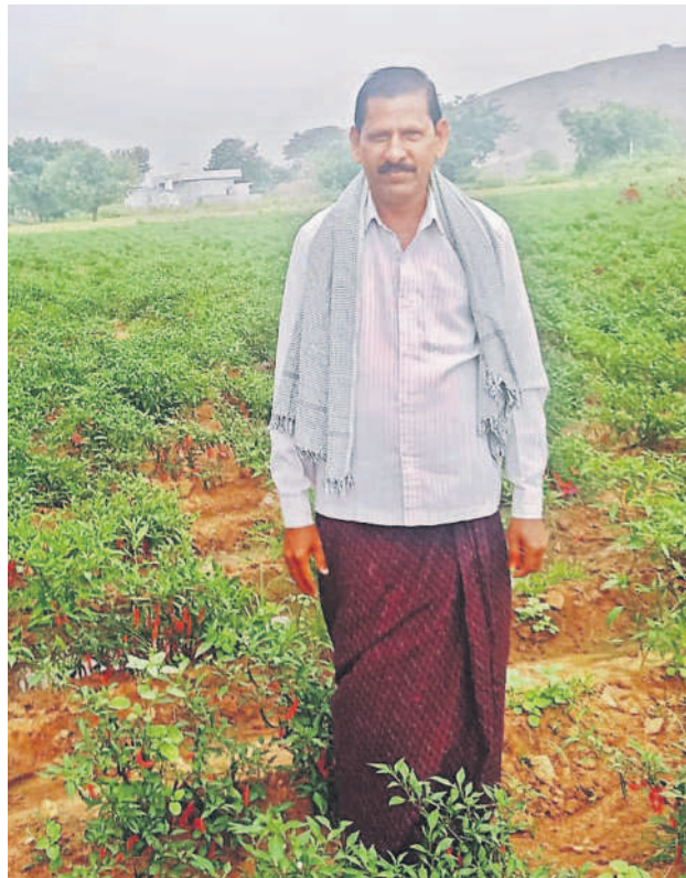
3గంటల కరెంటు ఏ మూలకూ చాలదు

కాంగ్రెస్ పార్టీ నాయకులకు వ్యవసాయం మీద కనీస అవగాహన లేదు. మూడు గంటల కరెంటు అని ఒకసారి, ఐదు గంటలు అని ఒకరు, 10 హెచ్పీ మోటార్లు అని ఇంకొకరు మాట్లాడుతున్నారు. ఒక ట్రాన్స్‌ఫార్మర్ మీద 10 హెచ్పీ మోటార్లు రెండంటితో లోడు ఎక్కువై కాళి పోతాయి. ఇప్పుడున్న మోటార్లు తీసేసి 10 హెచ్పీ మోటార్లు పెడితే ట్రాన్స్‌ఫార్మర్లు మార్చాల్సి వస్తుంది. వ్యవస్థ మొత్తం పాడయిపోయింది. అది రైతుల మీద అధిక భారం పడుతుంది. 24 గంటల కరెంటు ఉంటేనే బివరి భూములకు పూర్తి స్థాయిలో నీరం దడం లేదు. ఇక 3, 5 గంటలు ఇస్తే ఏ మూలకూ సరిపోదు. గతంలో రాత్రి కరెంటు ఇవ్వడం వల్ల రైతులు పొలాల్లో పాముకాటుకు, విద్యుత్ షాక్‌కు గురై ప్రాణాలు పోయిన సంఘటనలు ఉన్నాయి. రైతుల కష్టాలు తెలిసిన సీఎం కేసీఆర్ 24 గంటల కరెంటు ఇస్తుంది. దీంతో వెలుతురు ఉన్నప్పుడే పొలానికి నీళ్లు పెట్టుకొని సాయంత్రానికి ఇంటికి చేరుకుంటున్నాం. మళ్ళీ ఆయనే గెలవాలి.