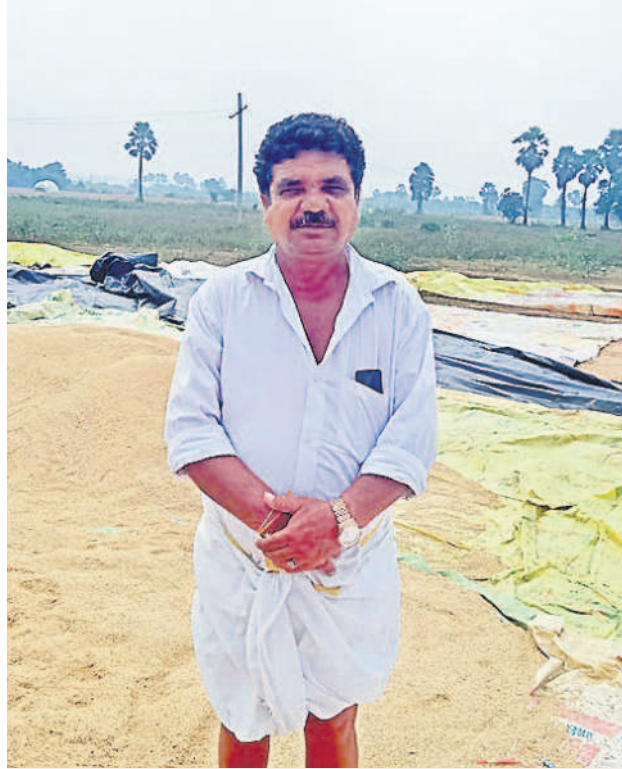
కాంగ్రెస్ కు ఓటేస్తే సాగు కష్టమే

కాంగ్రెస్ కు ఓటేస్తే రైతులు వ్యవసాయంపై ఆశలు వదులుకోవాల్సిందే. మళ్ళీ బీకే రాత్రులతో సహజీవనం చేయాల్సిన ప్రయత్నం ఉన్నది. గతంలో రైతులు కరెంటు కోసం రాత్రివేళ పొలాల్లో వద్ద కాపలా కాసేది. ముందుగా పెట్టినోళ్ల మోటార్ ఎత్తుకునేది. ఆ తరువాత వారిది ఎత్తుకోవడమే. తెలంగాణ రాష్ట్రం వచ్చి నాకే కేసీఆర్ సారే రైతుల రాత్రులు మాన్పారు. 24 గంటల కరెంటుతో ఎన్ని ఎకరాలైనా పారుతున్నది. దాంతో వ్యవసాయం పండుగలా మారింది. కాంగ్రెస్ పార్టీ మూడు గంటల కరెంటు చాలని రైతులను చిన్నచూపు చూస్తున్నది. వారికి ఓటుతో బుద్ధి చెప్పాం. పంట పొలాలు, స్కూలు విలువలు పెంచి, రైతులను రాజాను చేసిన బీఆర్ఎస్ ప్రభుత్వానికి పూర్తి మద్దతు ఇస్తాం.