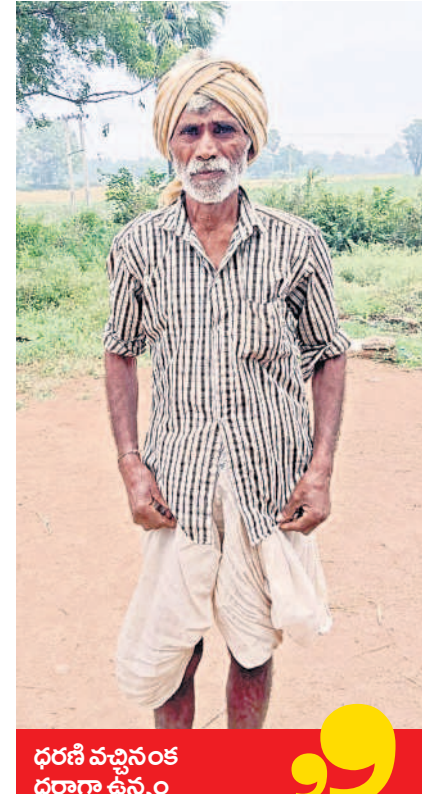
ధరణి వచ్చినంత దర్జాగా ఉన్నం

ధరణి వచ్చినప్పటి నుంచి భూములు విషయంలో నిశ్చింతగా ఉన్నం. గిడివరకు హాజీల్లో వీఆర్ఎస్ ఇష్టమొచ్చినట్టు పేర్లు మార్చేది. ఆఫీసుల చుట్టూ తిరిగినా పనులు కాకపోయేటివి. ధరణి రాక ముందు భూమి రిజిస్ట్రేషన్ చేసుకున్న కర్షాక జమాబందీ కోసం వీఆర్ఎస్ ఆర్డర్ చుట్టూ నెలల కొద్ది తిరిగింది. గిప్పుడు గా బాధలేవే. రిజిస్ట్రేషన్ కాగానే భూమి పాస్ పుస్తకంలో ఎక్కిస్తారు. వేలి ముద్ర వేస్తే తప్ప రికార్డులు మార్చవు. రైతుల మేలు కోసం సీఎం కేసీఆర్ గింత మంచి ధరణి పోర్టల్ తీసుకొస్తే దానిని తీసేస్తామని కాంగ్రెస్ పోర్టల్ అంటున్నారు. గిప్పుడే మళ్ళా రైతులు ఇబ్బంది పడుతారు. రైతులు నిశ్చింతగా ఉండుడు గా లీడర్లకు ఇష్టం లేవట్టుంది. మళ్ళా దళారుల రాజ్యం తెస్తామని చూస్తున్నట్టున్నారు.