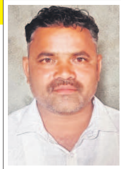
రాజానాయక్, పలుగురాళ్ల తండా, కొడంగల్

ఎన్నికల్లో విజయం సాధించక ముందే రేవంత్ రెడ్డి రైతుబంధుపై మాట మార్చడం సిగ్గుచేటు. అధికారంలోకి వచ్చిన తర్వాత రైతు బంధును.. భూ యజమానికి లేదా కౌలుదారుకు ఇస్తామని చెప్పడం ప్రజలను మోసం చేయడమే అవుతుంది. కానీ.. సీఎం కేసీఆర్ ప్రభుత్వం రైతులకు చెప్పిన విధంగా రైతు బంధును పంపిణీ చేస్తూ ఆడుకుంటున్నది. ప్రజలను మోసం చేసే కాంగ్రెస్ కంటే ప్రజలకు అండగా ఉండే బీఆర్ఎస్ ప్రభుత్వానికే ప్రజలందరూ మద్దతునిస్తారు. నా ఓటు బీఆర్ఎస్ కే.. సీఎం కేసీఆర్ ప్రభుత్వానికే నా మద్దతు.