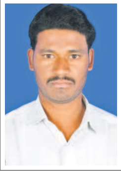
సాయిలు, రైతు, చిన్ననందిగామ, కొడంగల్

ఎన్నికలకు ముందే పీసీసీ అధ్యక్షుడు రైతుబంధుపై మాట మార్చాడు. కౌలు రైతుకు రైతు బంధు ఇస్తే.. యజమానికి రాదని, యజమానికి వస్తే కౌలురైతుకు రాదని చెప్పడం చూస్తుంటే.. అధికారంలోకి వచ్చిన తర్వాత వారు మ్యూనిసిపాలిటీలో పెట్టిన అన్ని హామీలను అమలు చేస్తారన్న నమ్మకం లేదు. కాంగ్రెస్ బుద్ధి ఎన్నికల ముందే బయటపడటం చాలా మంచిదైంది. కాంగ్రెస్ను గెలిపిస్తే ప్రజలు ఆగమవుతారు. నా ఓటు రైతులకు అండగా ఉన్న బీఆర్ఎస్ కే.