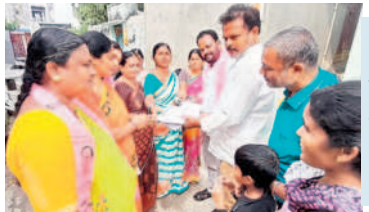
కరీమాబాద్: 40వ డివిజన్ లో ప్రచారం చేస్తున్న బీఆర్ఎస్ నాయకులు