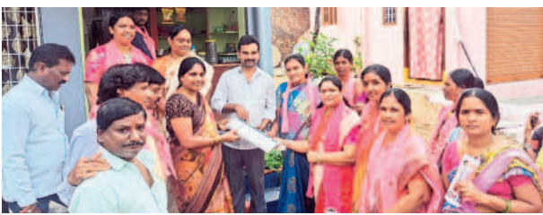
గిర్నాజీపేట: డమ్మి కువీఎంతో ప్రచారం చేస్తున్న కార్పొరేటర్ శిరీష, బీఆర్ఎస్ నాయకులు, కార్యకర్తలు