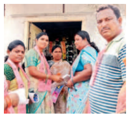
ఖిలావరంగల్: పడమర కోటలో ప్రచారం చేస్తున్న ఉమ