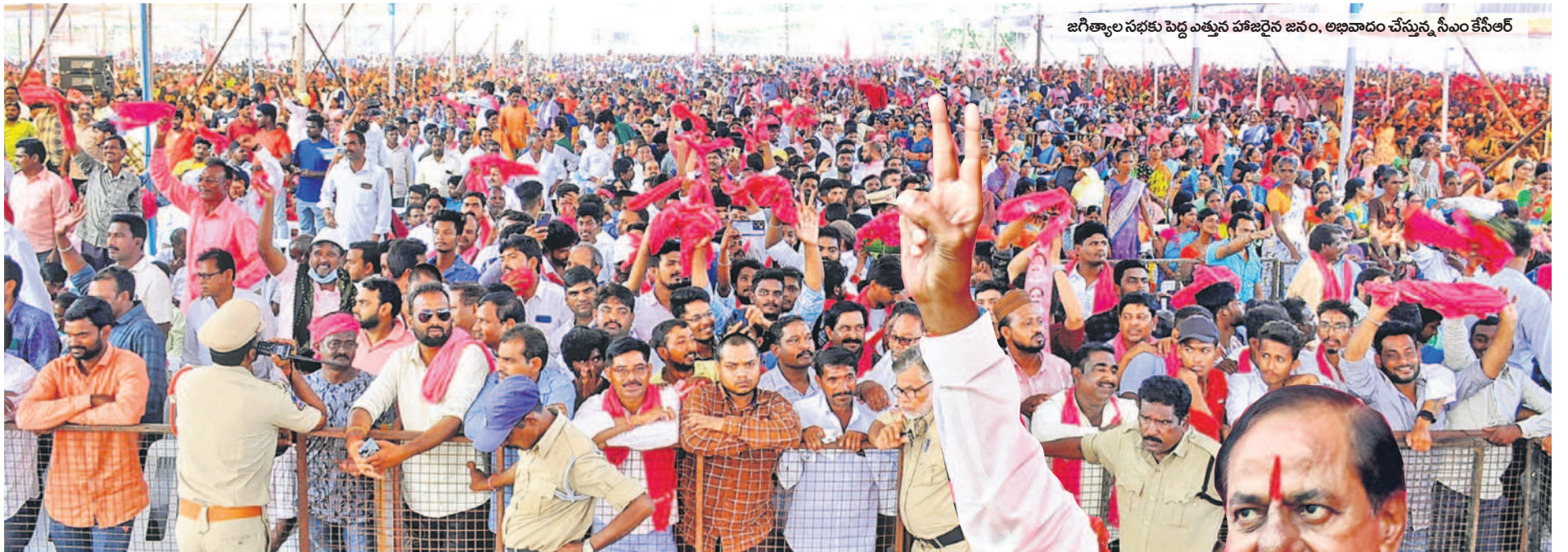
జగిత్యాల సభకు పెద్ద ఎత్తున హాజరైన జనం, అభివాదం చేస్తున్న సీఎం కేసీఆర్