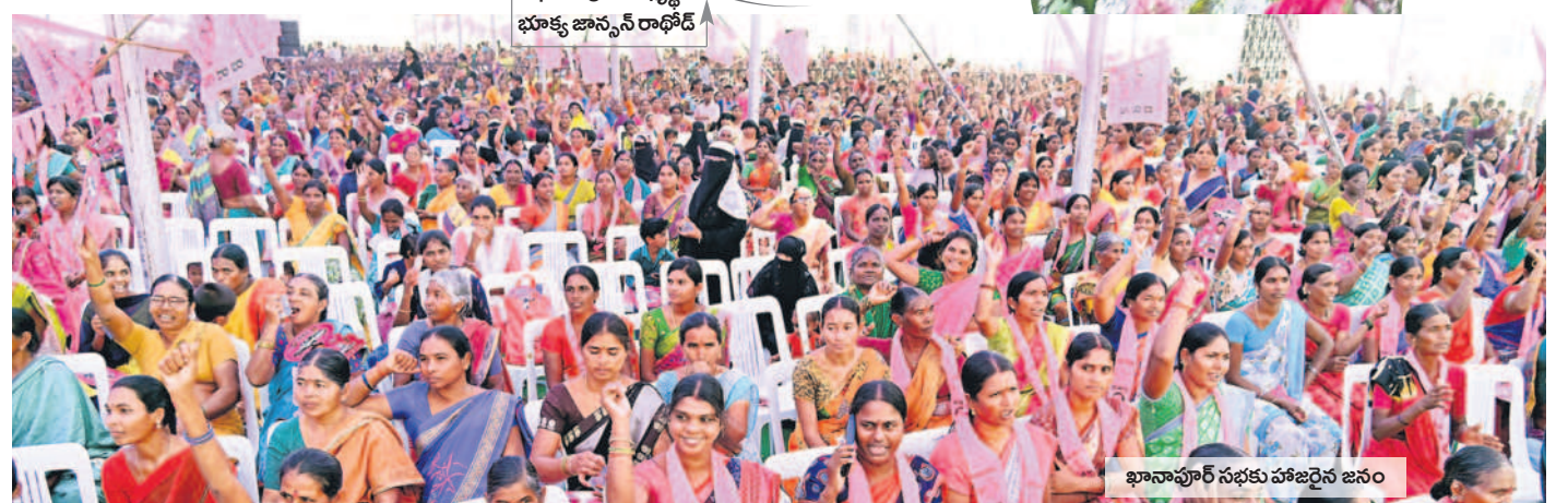
ఖానాపూర్ సభకు హాజరైన జనం