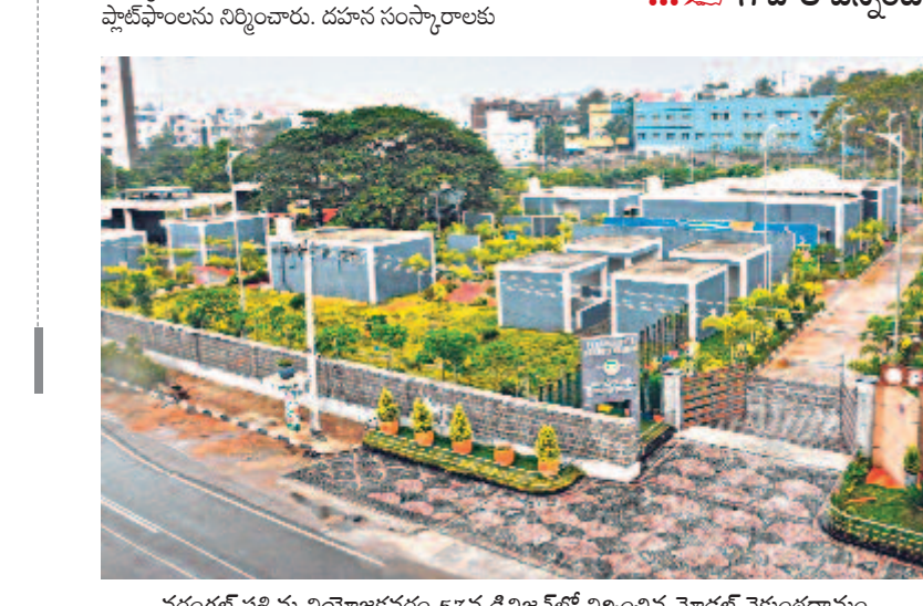
వరంగల్ పశ్చిమ నియోజకవర్గం 57వ డివిజన్లో నిర్మించిన మోడల్ వైకుంఠధామం

చారిత్రక వరంగల్ నగరం సరికొత్తగా మారుతున్నది. రాష్ట్ర ప్రభుత్వం ప్రణాళికాబద్ధంగా చేస్తున్న అభివృద్ధి పనులతో అన్ని వసతులను సమకూర్చుకుంటున్నది. రోజూ తాగునీటి సరఫరా, మెరుగైన రవాణా కోసం రోడ్ల విస్తరణ, మురుగునీటి పారుదల వ్యవస్థ, సమీకృత మార్కెట్లు, ఆహారం పంపే పార్కులతోపాటు వైకుంఠధామాలను నిర్మిస్తున్నారు. వరంగల్ పశ్చిమ నియోజకవర్గంలోని రూ.3 కోట్లతో వైకుంఠ ధామం నిర్మించింది. నగరాల్లోని కిరాయి ఉండే వారి ఇంట్లలో ఎవరైనా కాలం చేస్తే ఇంటి యజమానుల నుంచి అవమానాలు ఎదురయ్యేవి. ఇక ఆ బాధలు తప్పాయి. ఇలాంటి వారి కోసం ప్రత్యేకంగా గదులను నిర్మించారు. అన్నికలు భద్రపరచేందుకు లాకప్.. మృతదేహాల ఖననం కోసం నాలుగు బర్నింగ్ ప్లాంట్లను నిర్మించారు. దుపాన సంస్కారాలకు