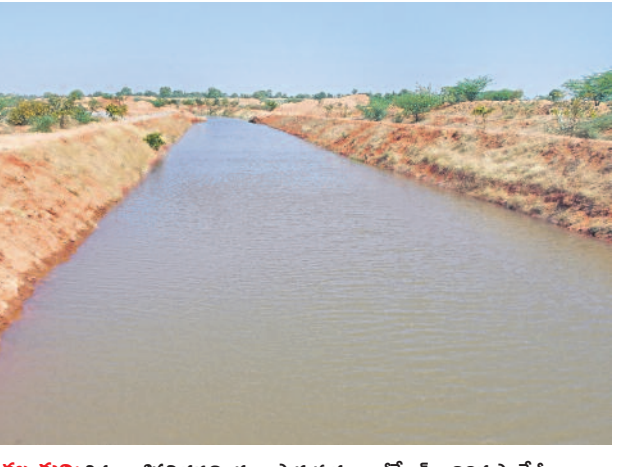
కల్వకుర్తి: తిన్నరాశిపల్లి వద్ద ముందుగా పారుతున్న అంబేకర్-29వ ప్యాకేజీ కాల్వ

పాలనా సౌలభ్యం కోసం కల్వకుర్తి రెవెన్యూ డివిజన్ ఏర్పాటు నియోజకవర్గంలో 5 మండలాల (కల్వకుర్తి, వెల్లిండ, ఆమనగల్లు, తలకొండ పల్లి, మాడ్గుల) ఉండేవి. ఈ మండలాల ప్రజలు రెవెన్యూ సమస్యల పరిష్కారం కోసం మహబూబ్ నగర్కు వెళ్ళాల్సి వచ్చేది. ఈ ఇబ్బందులను అధిగమించేందుకు కల్వకుర్తి, వెల్లిండ, మంగూర్, చారకొండ, ఊర్కొండ మండలాలతో కల్వకుర్తి రెవెన్యూ డివిజన్ ఏర్పాటు అయ్యింది. తలకొండపల్లి, ఆమనగల్లు మండలాలలోని కొన్ని గ్రామాలతో కొత్తగా కడ్రాల మండలం ఏర్పడింది. ప్రజల ఆకాంక్ష మేరకు ప్రభుత్వం ఆమనగల్లు, తలకొండపల్లి, మాడ్గుల, కడ్రాల మండలాలను రంగారెడ్డి జిల్లాలో కలిపింది.