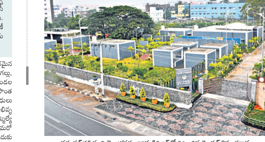
వరంగల్ పశ్చిమ నియోజకవర్గం 57వ డివిజన్లో నిర్మించిన మోడల్ వైకుంఠధామం

అన్నికలు భద్రపరిచేందుకు లాకప్డ్.. మృతదేహాల ఖననం కోసం నాలుగు బర్నింగ్ ప్లాట్లను నిర్మించారు. దుసరం సంస్కారాలకు