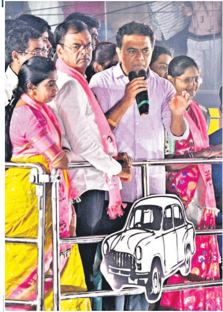
అంబర్పేట రోడ్ షోలో మాట్లాడుతున్న మంత్రి కేటీఆర్, చిత్రంలో ఎమ్మెల్యే కాలేరు వెంకటేశ్