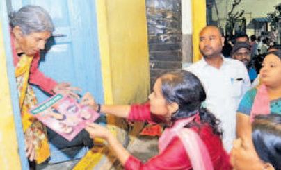
అవ్వ.. కారుకు ఓటు వేయి అంటూ వృద్ధురాలికి కారు గుర్తును చూపిస్తున్న లాస్యనందిత