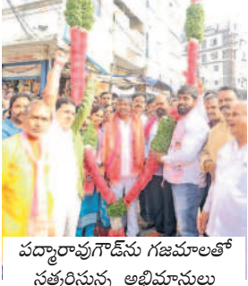
పద్మారావుగౌడ్ ను గజమాలతో సత్కరిస్తున్న అభిమానులు