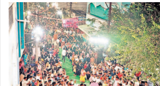
మైనార్టీల సమావేశానికి భారీ సంఖ్యలో హాజరైన ముస్లింలు