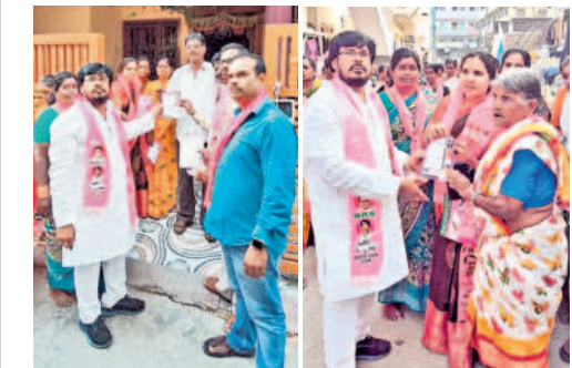
మాణిక్యగిరి నగర్లో ఇంటింటా ప్రచారం నిర్వహిస్తున్న బీఆర్ఎస్ నాయకులు