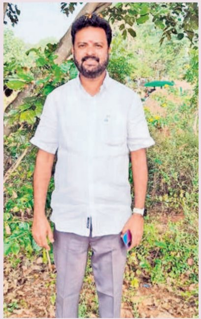
భూముల విలువ పడిపోతుంది..

నర్సంపేట : రైతులు, కౌలు రైతులకు మధ్యన వివాదాలు వస్తాయి. రైతుబంధును కౌలు రైతులు, రైతుల్లో ఎవ్వరికైనా ఒకరికి ఇస్తామని కాంగ్రెస్ నాయకులు అంటున్నారు. దీనివల్ల రైతులు, కౌలు రైతులకు మధ్య గొడవలు జరిగి, శాంతిభద్రతల సమస్యలు ఏర్పడతాయి. కరెంటు మూడు గంటలే ఇస్తామని చెప్పడం విడ్డూరంగా ఉంది. కాంగ్రెస్ నాయకులను నమ్మి రైతులు వ్యవసాయం చేయలేరు. రైతుల భూములకు విలువ కూడా బాగా తగ్గిపోతాయి. సీఎం కేసీఆర్ పాలనలోనే పుష్కలంగా సాగునీరు, విద్యుత్తో పాటు రైతులందరి ఇవ్వడంతో భూములకు విలువ పెరిగి, రైతులు భరోసాతో బతుకుతున్నారు. రైతుబంధుతో రైతులకు ఎంతో ఉపయోగపడింది. ఇప్పుడు ధరలే ఎత్తైనామని, సీఎం కేసీఆర్ డబ్బులను వుల్గా చేస్తున్నారని అంటున్నారు. ఇలా కాంగ్రెస్ నాయకులు మాట్లాడడం కరెక్ట్ కాదు. దీని వల్ల సమస్యలు ఏర్పడతాయి. రైతులకు ఎంతో ప్రయోజనం ఉంటుంది. రైతులందరూ బీఆర్ఎస్‌కు మద్దతుగా నిలవాలి.