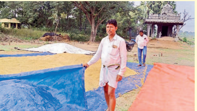
దళారుల సంపాదనకే ధరణి రద్దు

రేగోన : కాంగ్రెస్లో దళారులు డబ్బులు సంపాదించుకోవడానికే ధరణి రద్దు చేస్తామంటున్నారని తప్ప వారి మేలు కోసం కాదు. అలాంటి రాక్షస కాంగ్రెస్ పాలన మాకు వద్దే వద్దు. ఎప్పుడు రైతు మేలు కోరి ప్రభుత్వం రావాలి. రైతు మేలు కోరి ప్రభుత్వం అంటే అది కేసీఆర్ సారే మాత్రమే. ఎండ తరబడి పట్టాల కోసం కార్యాలయాలకు మట్టు చెప్పాలిగోనా తిరిగినా ఎవలూ పట్టించుకోలేదు. దీంతో మా భూమి జాగ్రత్త రక్షణ లేకుండా పోయింది. పాపం కేసీఆర్ సారే దయవల్ల మా భూములకు రక్షణ రావడంతో బ్యాంకోళ్లు మా ఇండ్ల వద్దనే వచ్చి లోస్సు ఇస్తున్నారు. మేము ఎక్కడున్నా రైతులందరి పైనను మంచిగ పడుతున్నాము. మాకు ఇలాంటి పాలనలే కావాలి అందుకు మేముకా కలిసి పనిచేస్తాం. కేసీఆర్ సారేనే సీఎం చేస్తాం.