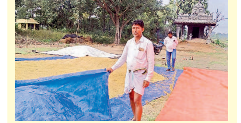
దళారుల సంపాదనకే ధరణి రద్దు