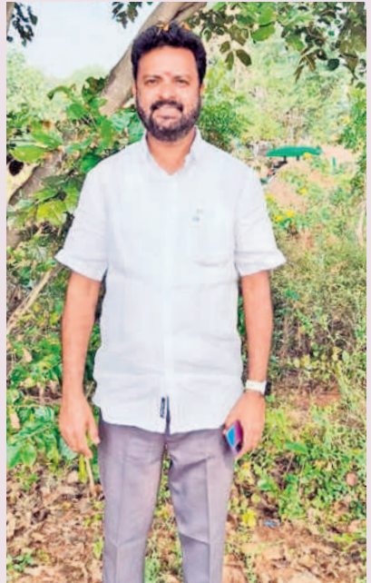
భూముల విలువ పడిపోతుంది..