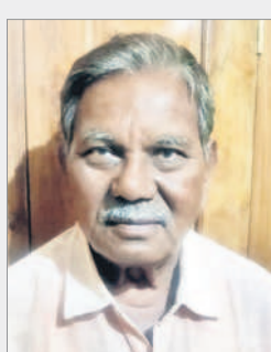
- నర్సింలు, లిబ్టర్ తహసీల్దార్

ప్రస్తుత ధరణి విధానంలో కొనసాగుతున్న భూముల పట్టాలు చాలా అద్భుతంగా ఉన్నాయి. 2020లో తీసుకువచ్చిన ధరణి స్థానంలో పాత విధానం తెస్తే మళ్లీ రికార్డులు కొత్తగా రాయాల్సిన అవసరం ఏర్పడుతుంది. అయితే అది చాలా కష్టమైన పని, సుమారు 3 సంవత్సరాల రికార్డులు రాయడానికి ఇబ్బందిగా మారుతుంది. ఇది అటు అధికార యంత్రాంగానికి ఇటు ప్రభుత్వానికి చాలా తలనొప్పిగా మారే అవకాశం ఉంటుంది. ధరణిని ముట్టుకుంటే ఇబ్బందులు పడాల్సి ఉంటుంది.