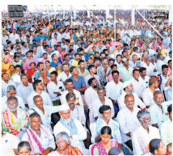
ఈనెల 19న జోగులాంబ గద్వాల జిల్లా అలంపూర్ లో నిర్వహించిన బీఆర్ఎస్ ప్రజాఆశీర్వాద సభకు ఇమిడిన రాజనంతోగా హాజరైన ప్రజలు