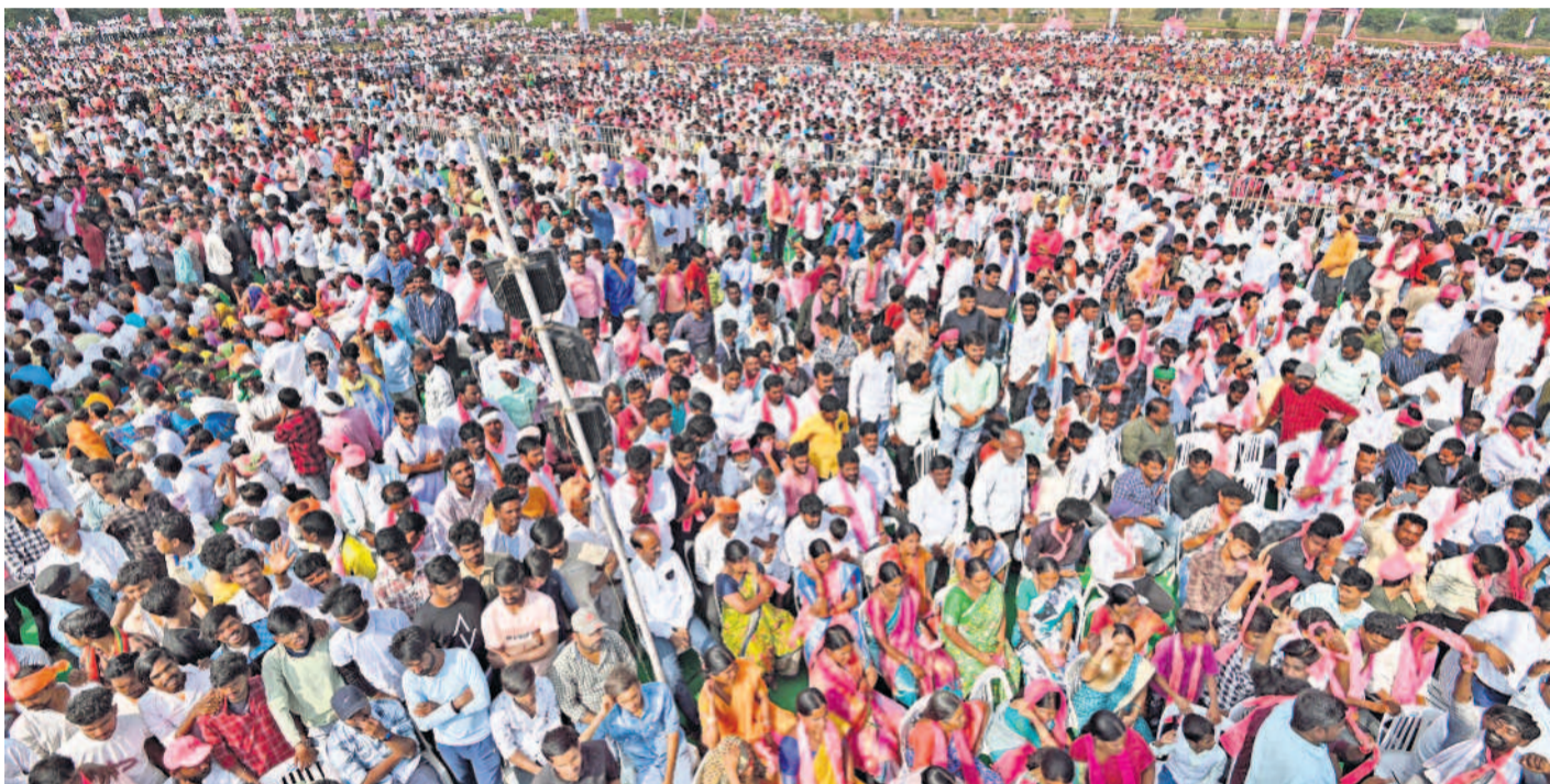
ఈనెల 16న అదిలాబాద్ జిల్లా బోధో నియోజకవర్గం ఇబ్రహీంపేటలో నిర్వహించిన సీఎం కేసీఆర్ ప్రజా ఆశీర్వాద సభకు తరలివచ్చిన ప్రజలు

ఎన్నికల తేదీ సమీపిస్తున్న కొద్దీ గులాబీ పరిమళం రాష్ట్రమంతా గుబాళిస్తున్నది. అదిలాబాద్ నుంచి పాలమూరు వరకు ఎక్కడ చూసినా 'జై తెలంగాణ' నినాదం మార్మోగుతూ ప్రత్యర్థుల గుండెలను భీద్రం చేస్తున్నది. బీఆర్ఎస్ అభ్యర్థులకు అడుగుడుగునా ప్రజలు నీరాజనం పలుకుతున్నారు. సీఎం కేసీఆర్ ను మూడోసారి సీఎంగా చూడాలని కలలుకంటున్న ప్రజలు బీఆర్ఎస్ అభ్యర్థులకు అండగా నిలుస్తున్నారు. అధికార పార్టీ అభ్యర్థులకు లభిస్తున్న ప్రజాదరణ ముందు ప్రత్యర్థి పార్టీలు వెలవెలబోతున్నాయి.