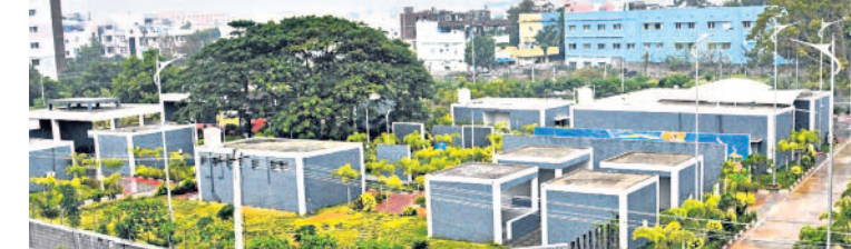
వరంగల్ పశ్చిమ నియోజకవర్గం 57వ డివిజన్లో నిర్మించిన మోడల్ వైకుంఠధామం

ముక్కడోల ఖాసం కోసం నాలుగు బర్లింగ్ ఫ్లాట్లను నిర్మించారు. దుసన సంస్కారాలకు