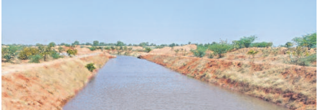
కల్వకుర్తి: తిమ్మరాశిపల్లి వద్ద ముందుగా పారుతున్న అంజనేయ-29వ ప్యాకేజీ కాలనీ

పాలనా సౌలభ్యం కోసం కల్వకుర్తి రెవెన్యూ డివిజన్ ఏర్పాటు నియోజకవర్గంలో 5 మండలాల (కల్వకుర్తి, వెల్లండ్, ఆమనగల్లు, తలకొండ పల్లి, మాడ్గులు) ఉండేవి. ఈ మండలాల ప్రజలు రెవెన్యూ సమస్యల పరిష్కారం కోసం మహబూబ్ నగర్కు వెళ్ళాల్సి