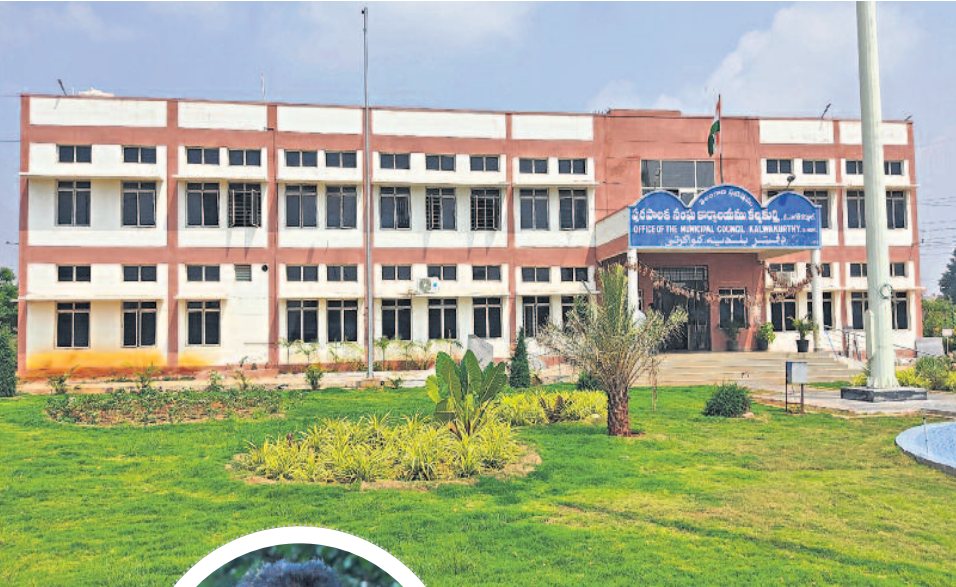
కల్వకుర్తి: అత్యాధునిక వసతులతో నిర్మించిన మున్సిపల్ కార్యాలయం